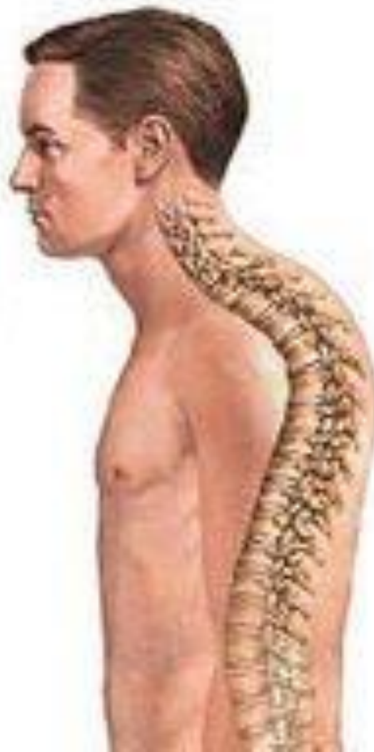
Спина с кифозом