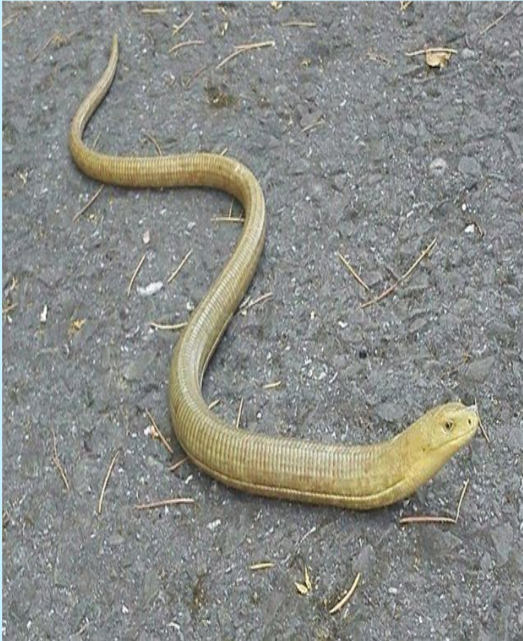
Безногая ящерица- желтопузик