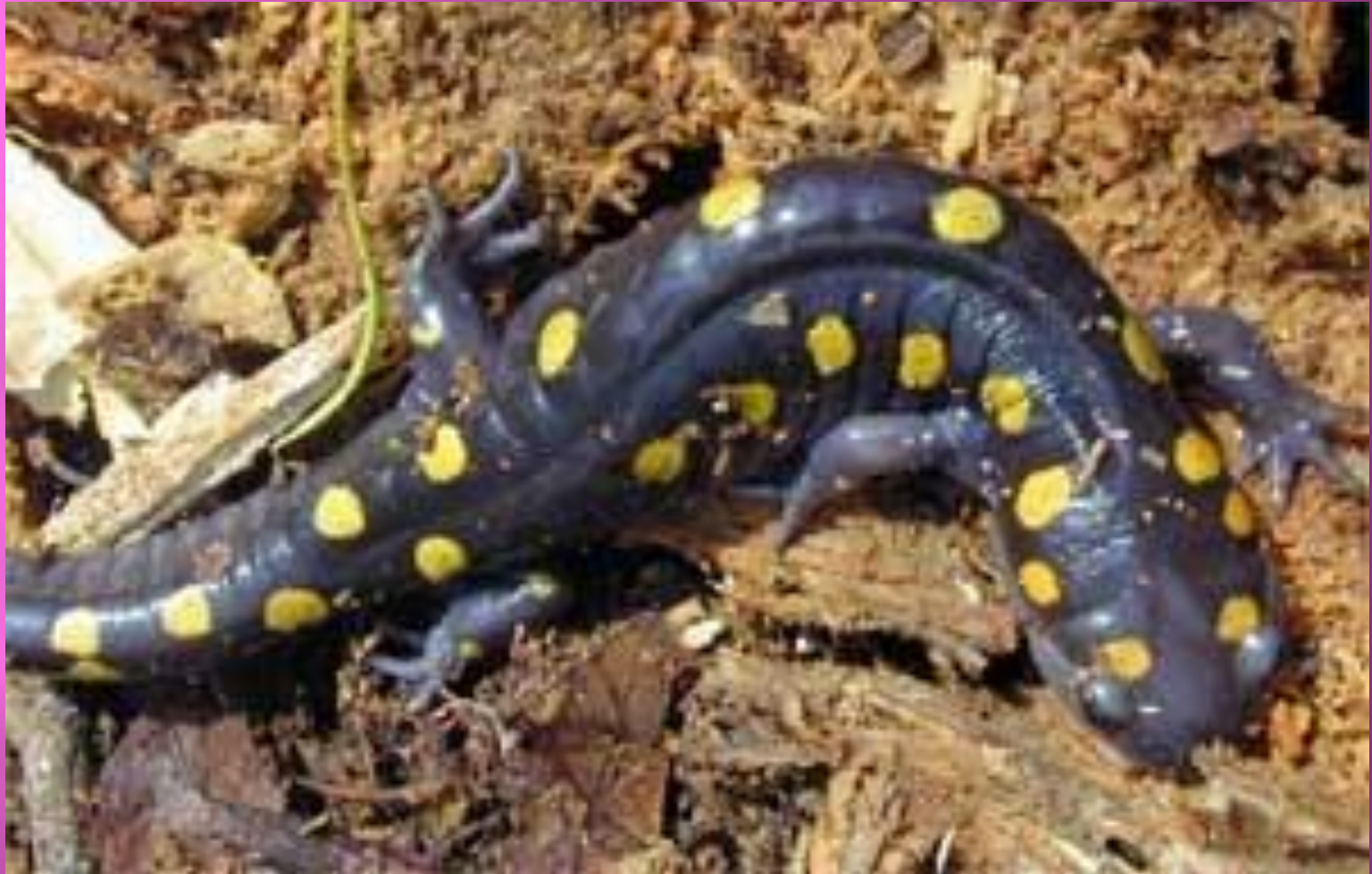
САЛАМАНДРА ПЯТНИСТАЯ или огненная саламандра