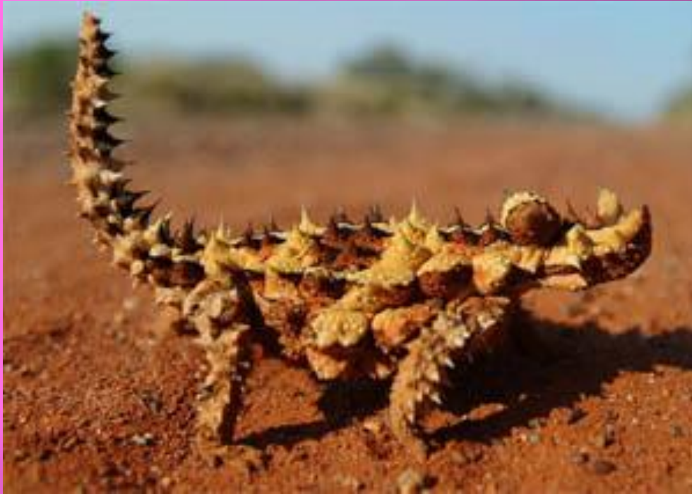
Устрашающая поза молоха