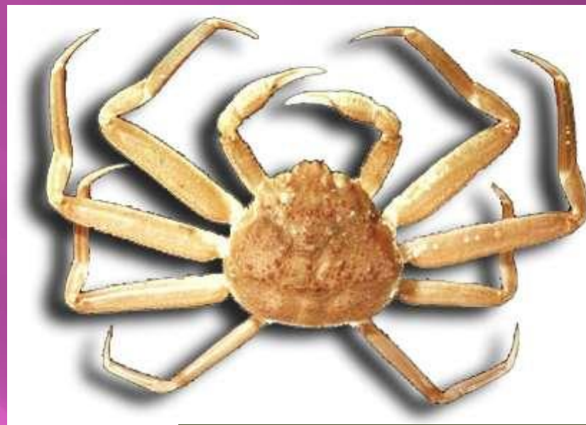
Краб - стригун