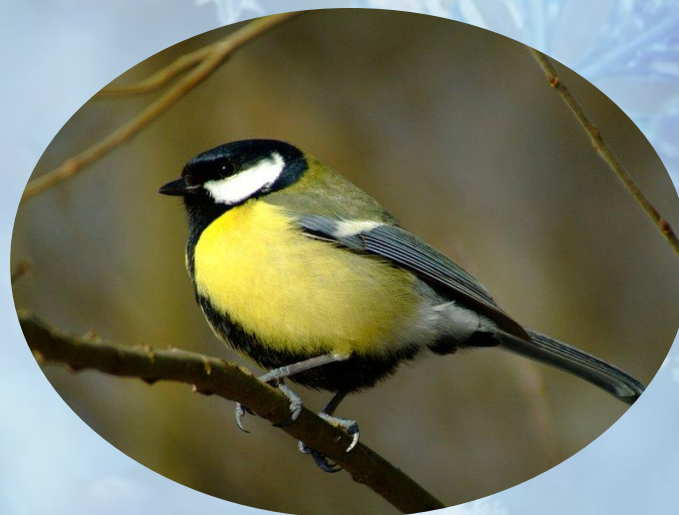
Команда «СИНИЧКИ» Школа №11