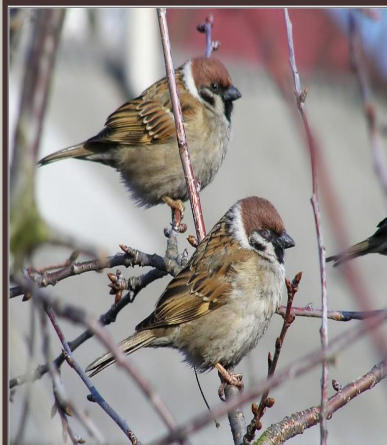
Воробьи полевые (Passer montanus) ♂ ♂