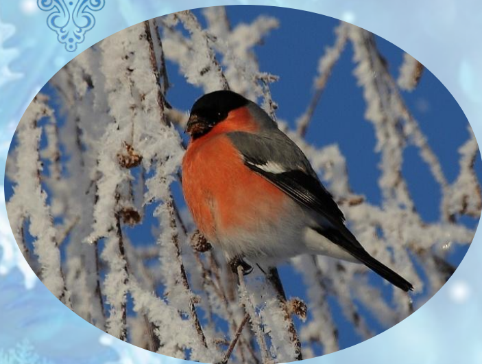
Команда «СНЕГИРИ» Школа №23