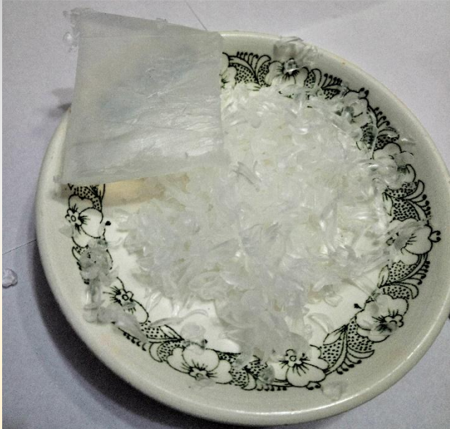
Натереть мыльную основу на те