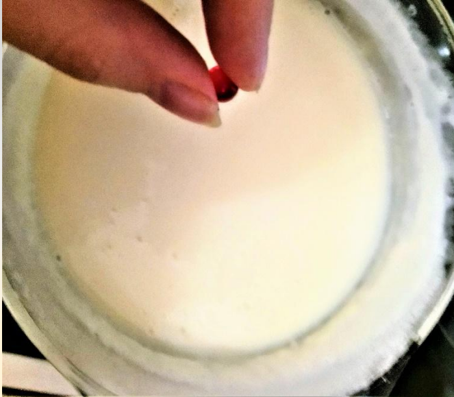
Добавить витамин Е