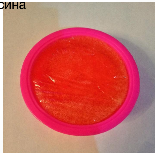
Залить в формочку