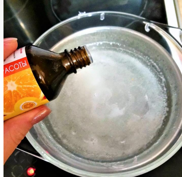
Добавить эфирное масло апельсина