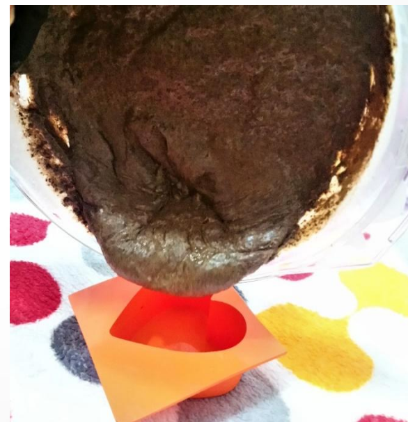
Перелить полученную смесь в форму