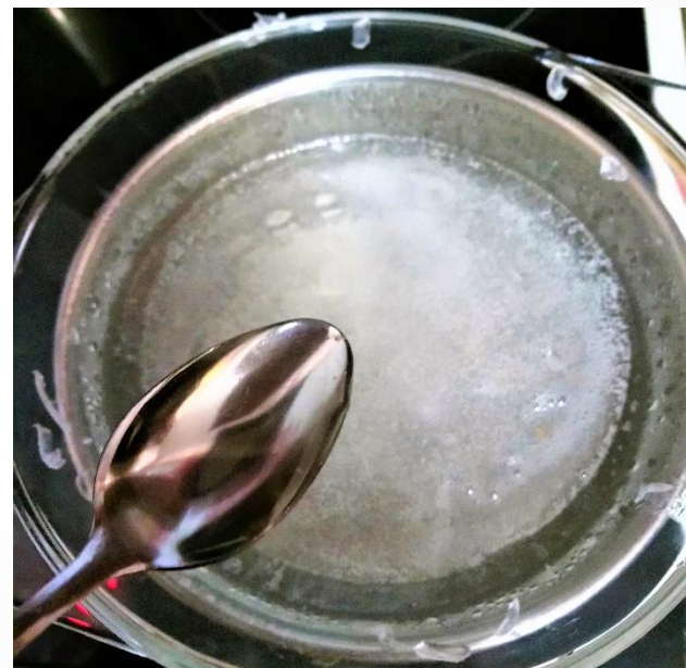
Добавить масло виноградной КОСТОЧКИ