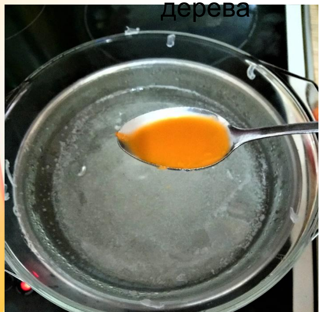
Добавить сок моркови