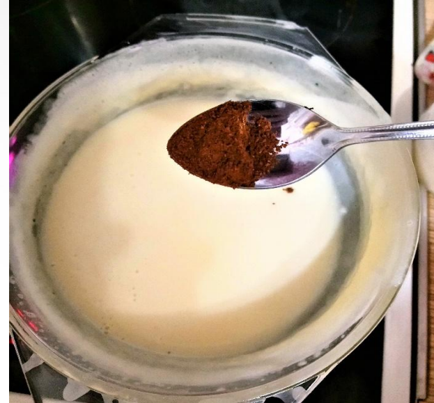
Добавить молотый кофе