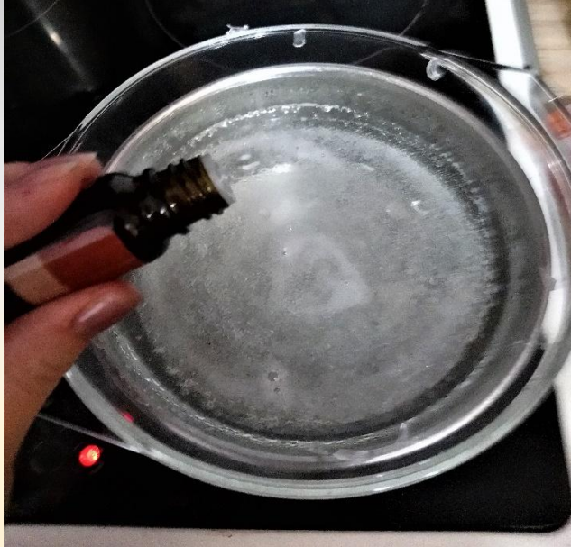
Добавить эфирное масло чайного дерева