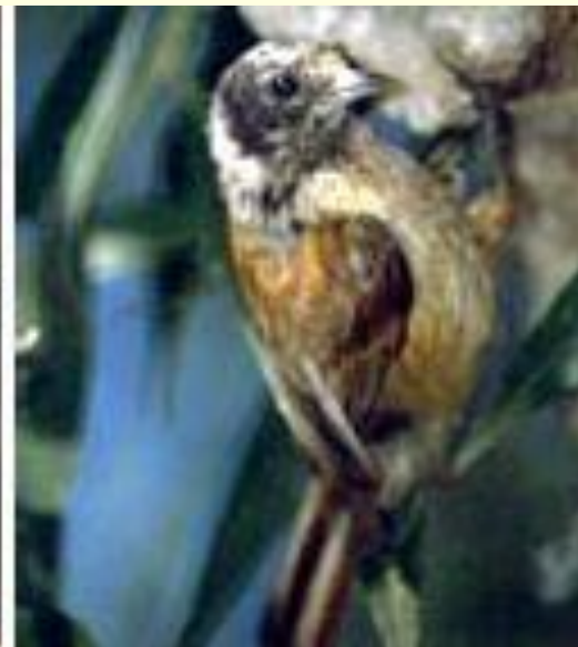
голубая лазоревка, большая синица, обыкновенный ремез