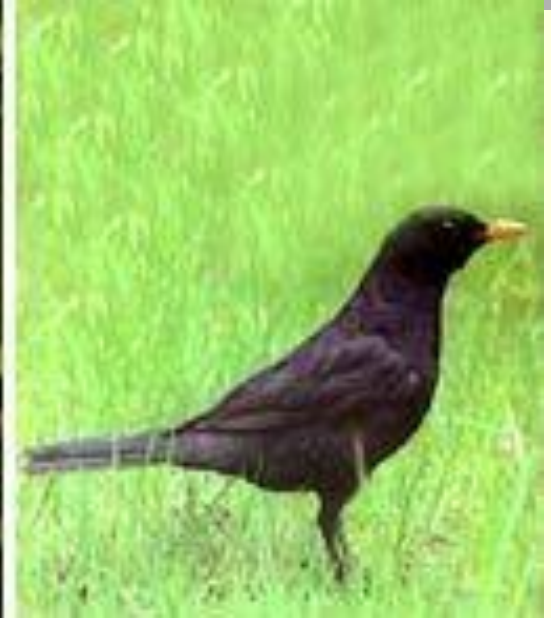
малиновка, восточный соловей, чёрный дрозд