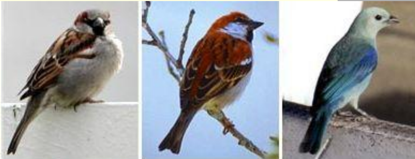
Домовой воробей, рыжий воробей, серо-голубая танагра