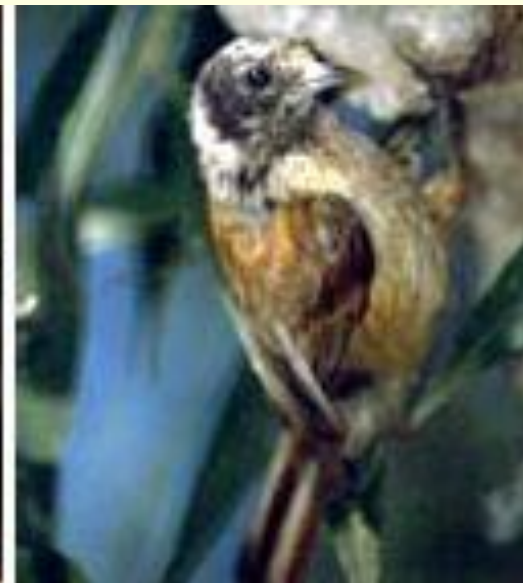
голубая лазоревка, большая синица, обыкновенный ремез