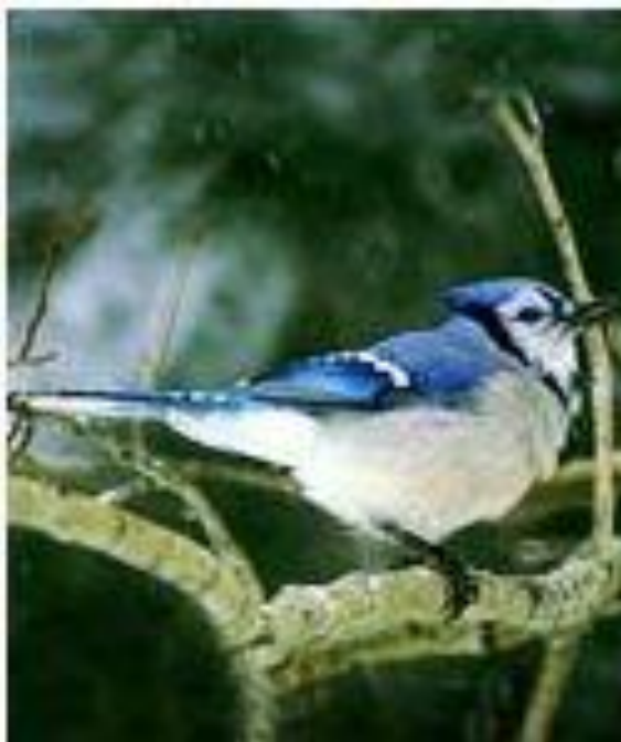
Голубая североамериканская сойка