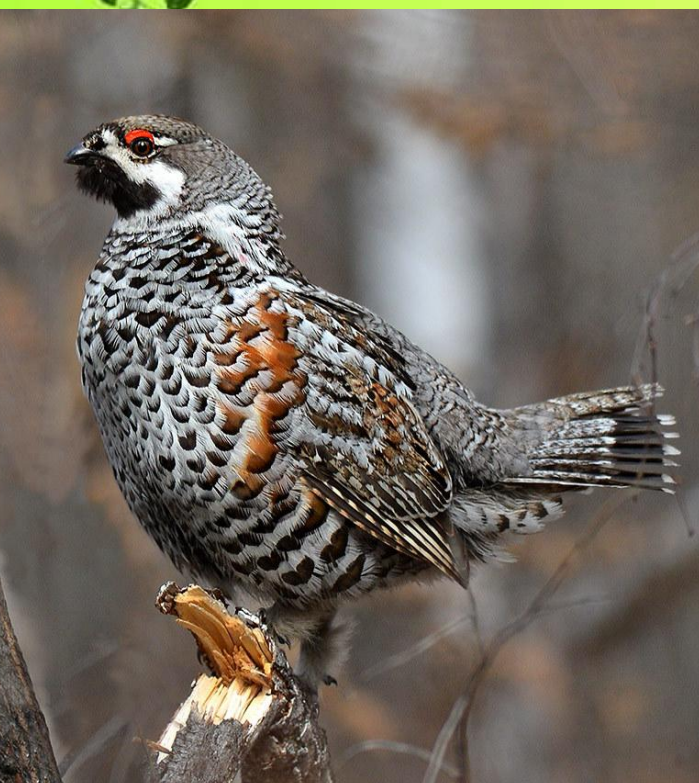
Каменная куропатка (кеклик)