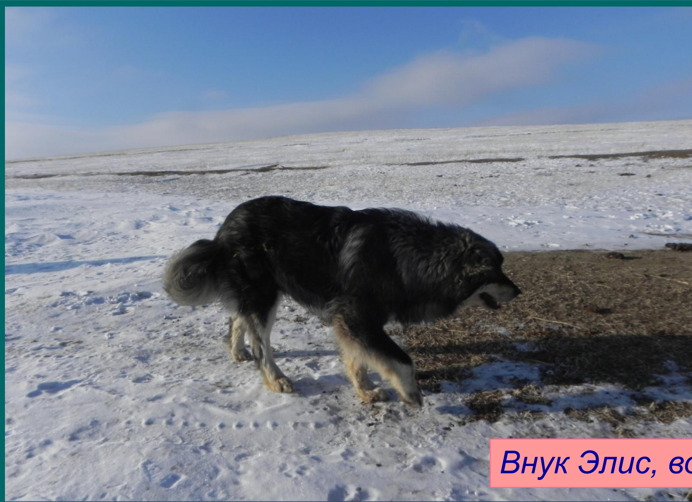
Внук Элис, возраст 8 мес.

Как все аборигенные породы Хотшо неприхотливы. Могут работать как при – 40, так и при + 40, потому что порода формировалась на протяжении тысячелетий в резко-континентальном климате.