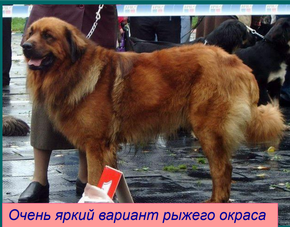
Очень яркий вариант рыжего окраса