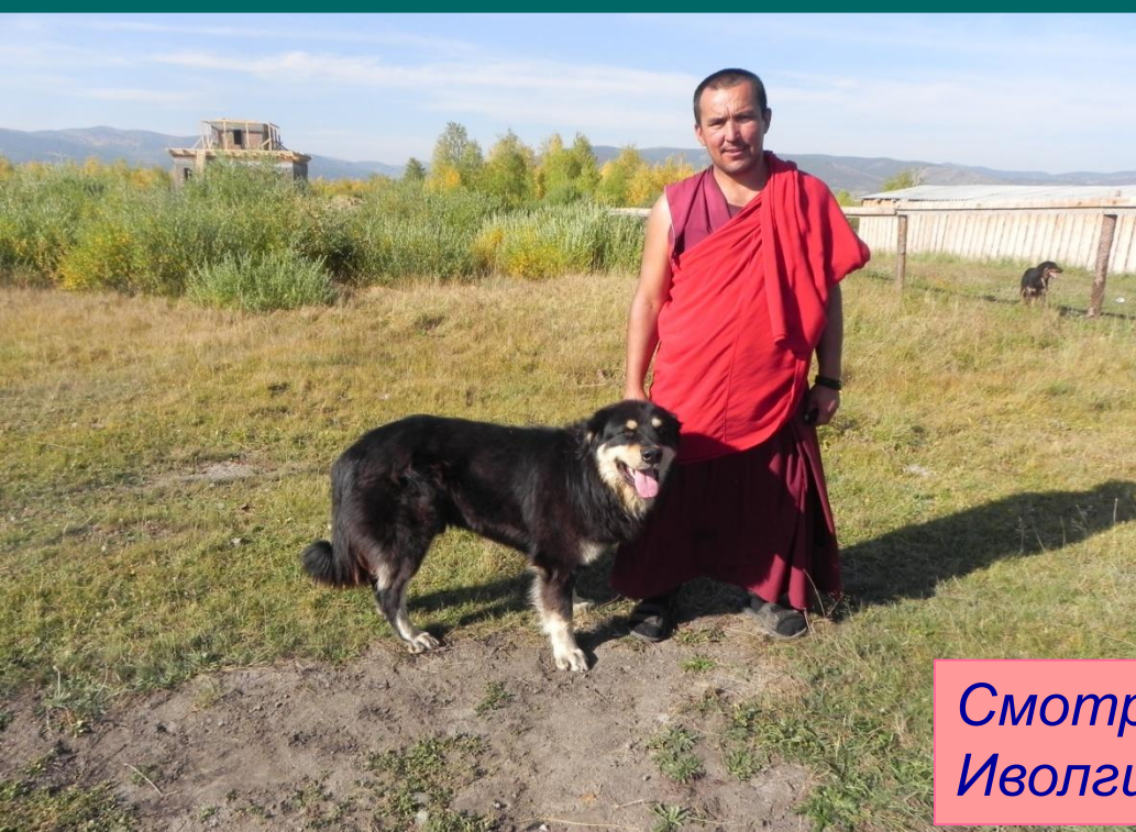
Смотритель питомника при Иволгинском дацане Санал-лама

Для этих целей при Иволгинском дацане был создан питомник по разведению бурят-монгольских овчарок. Сегодня в Бурятии фермеры стали охотно приобретать этих собак для работы со своим скотом.