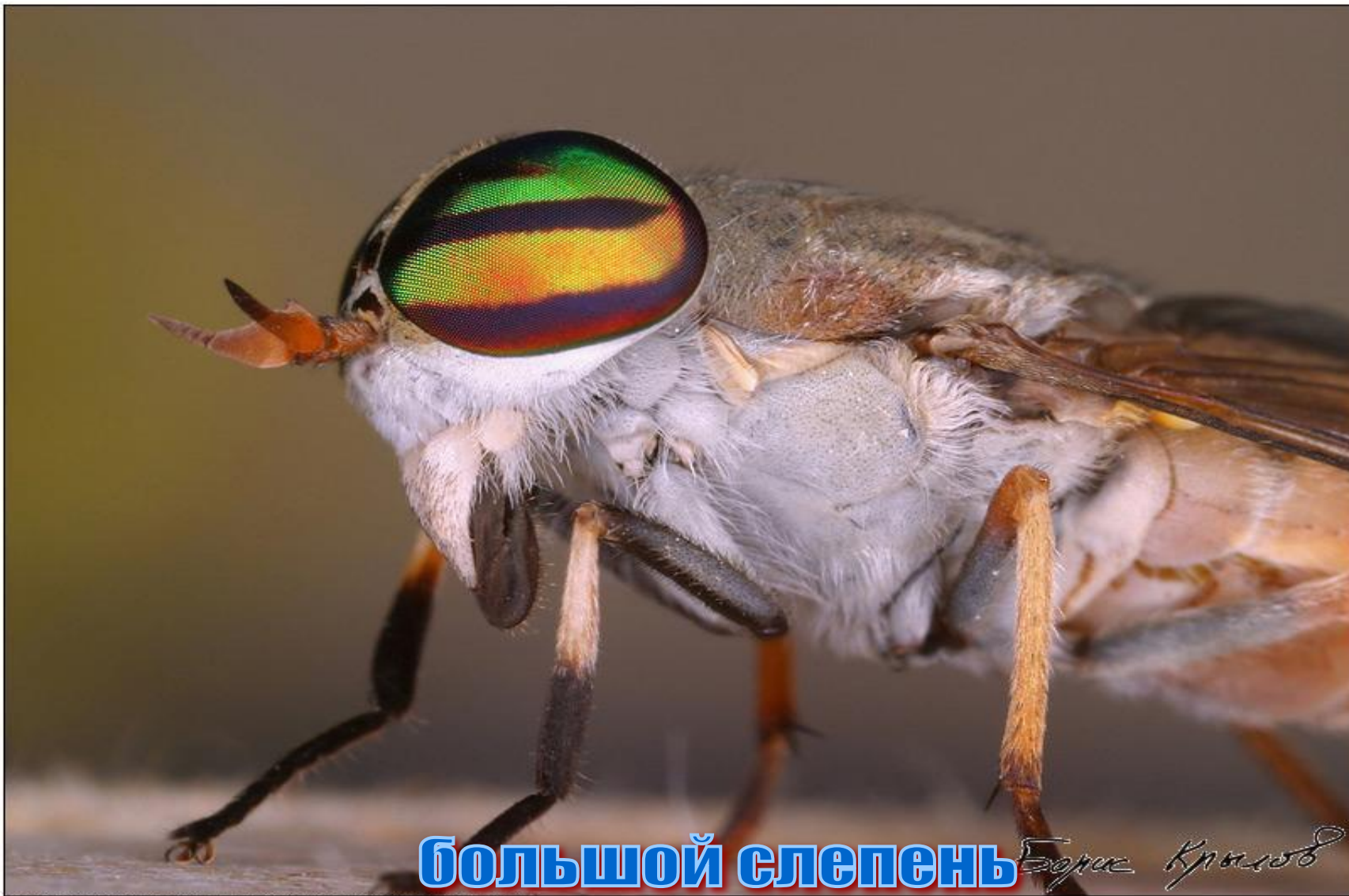
БОЛЬШОЙ СЛЕПЕНЬ Борис Крылов

COPYRIGHT © 2004-2005 BORIS KRYLOV, WWW.MACRO-PHOTO.ORG