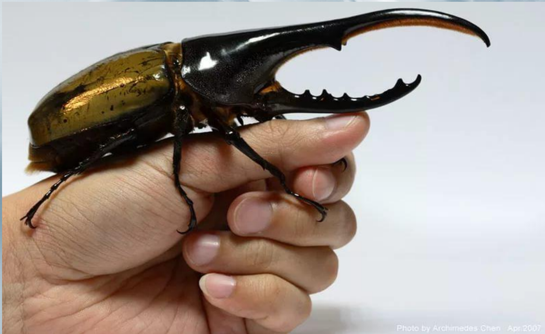
Apr. 2007