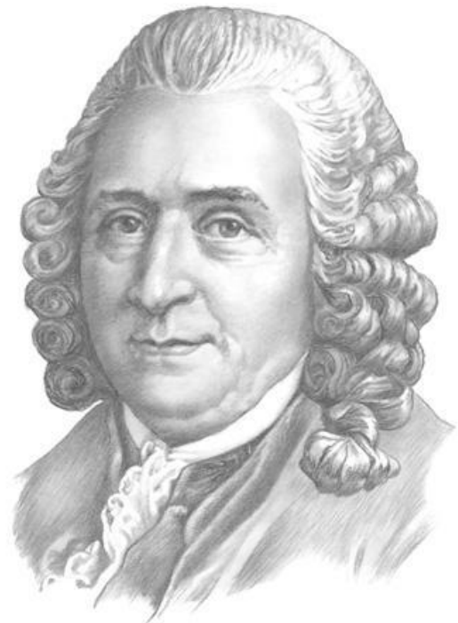
Карл Линней 1707—1778

Шведский ученый- натуралист XVIII в. Написал книгу «Система природы» , где дал классификацию растений, животных и даже минералов.