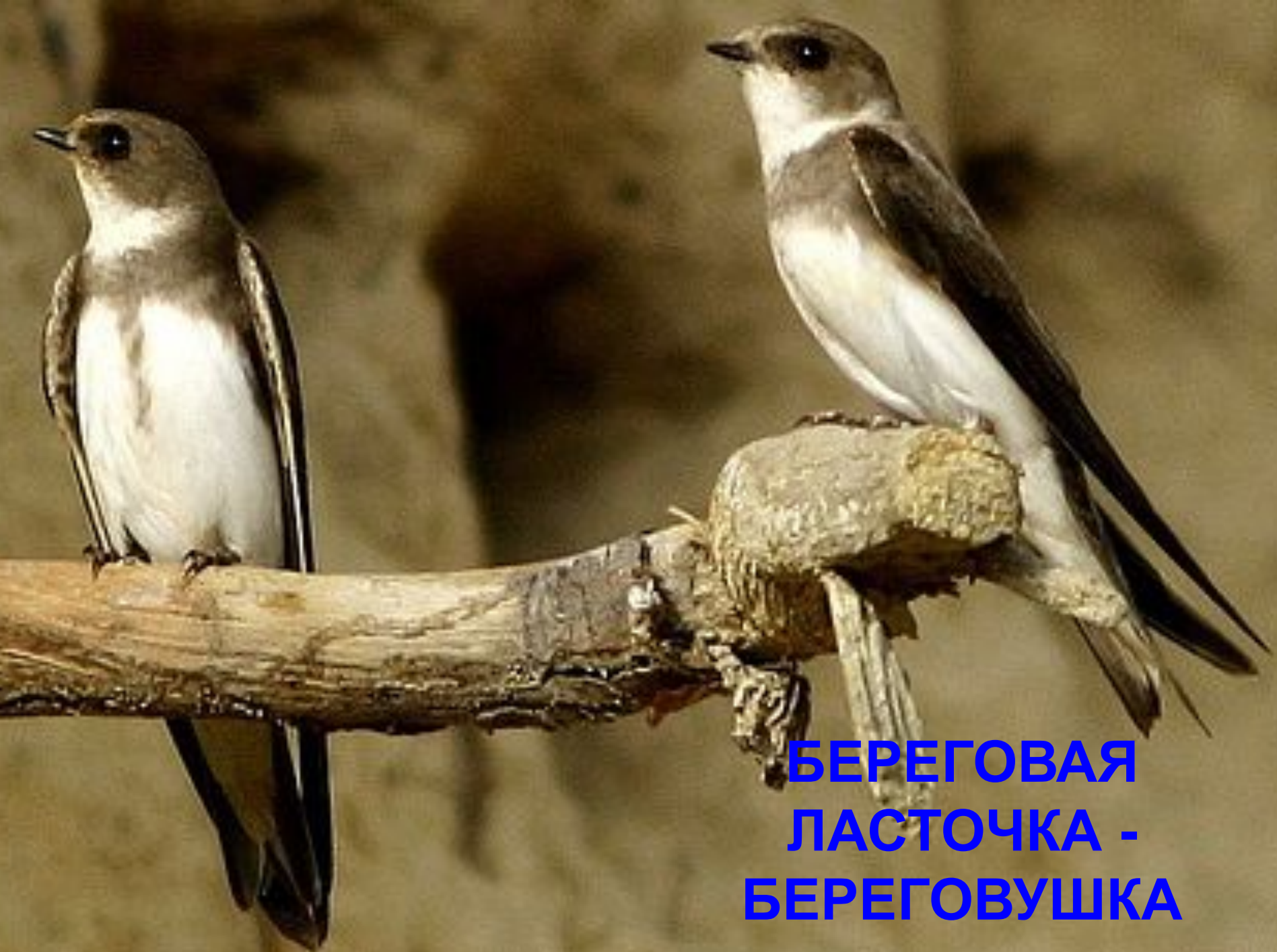
БЕРЕГОВАЯ ЛАСТОЧКА - БЕРЕГОВУШКА