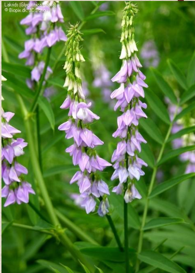
Lakrids (Glycyrrhiza glabra)