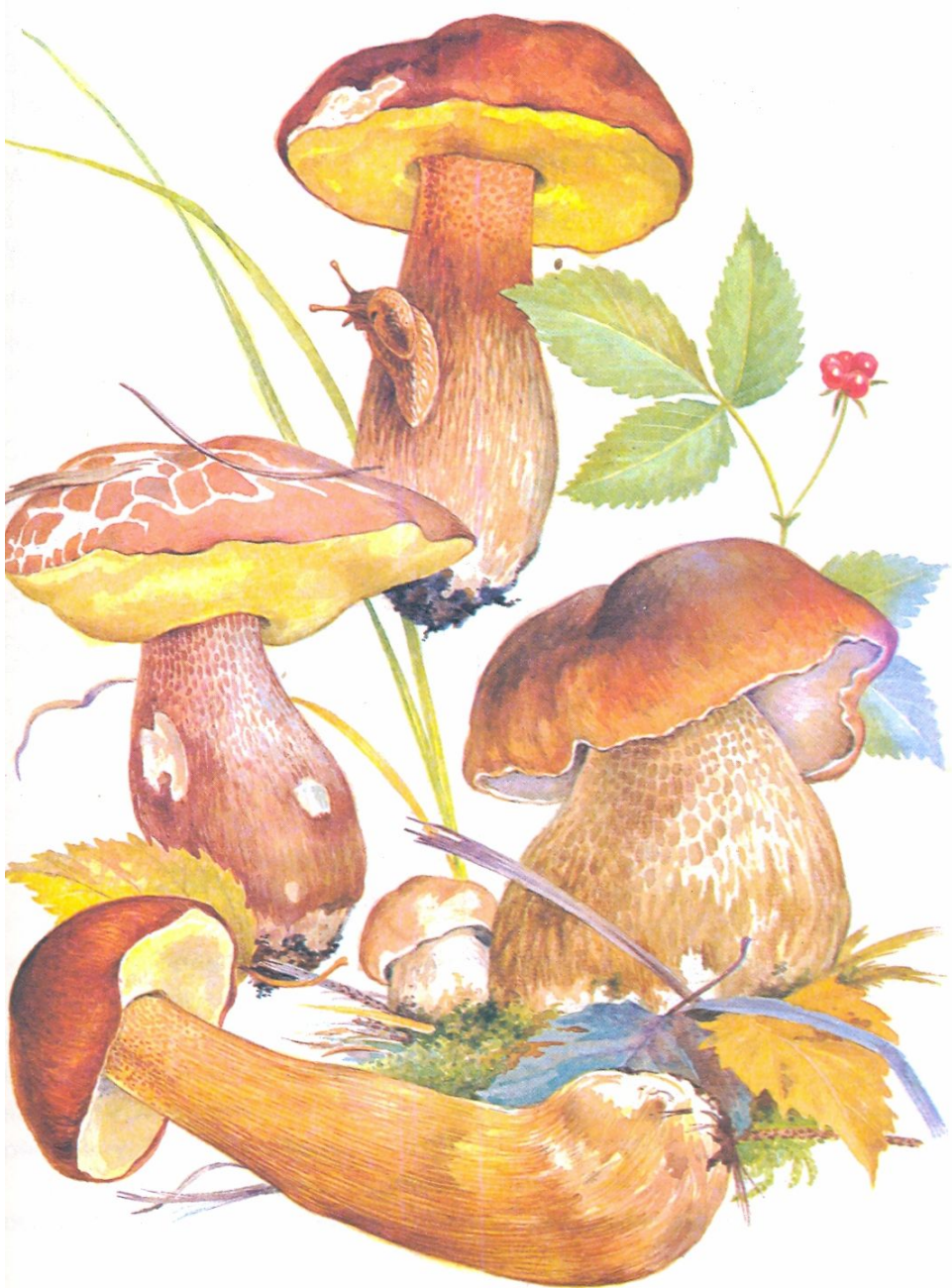
боровик (белый гриб)