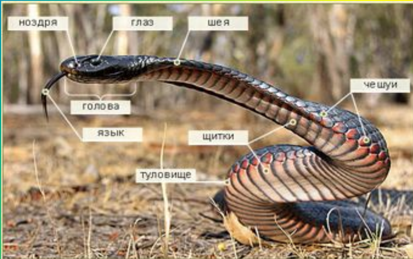
Ядовитая змея черная мамба