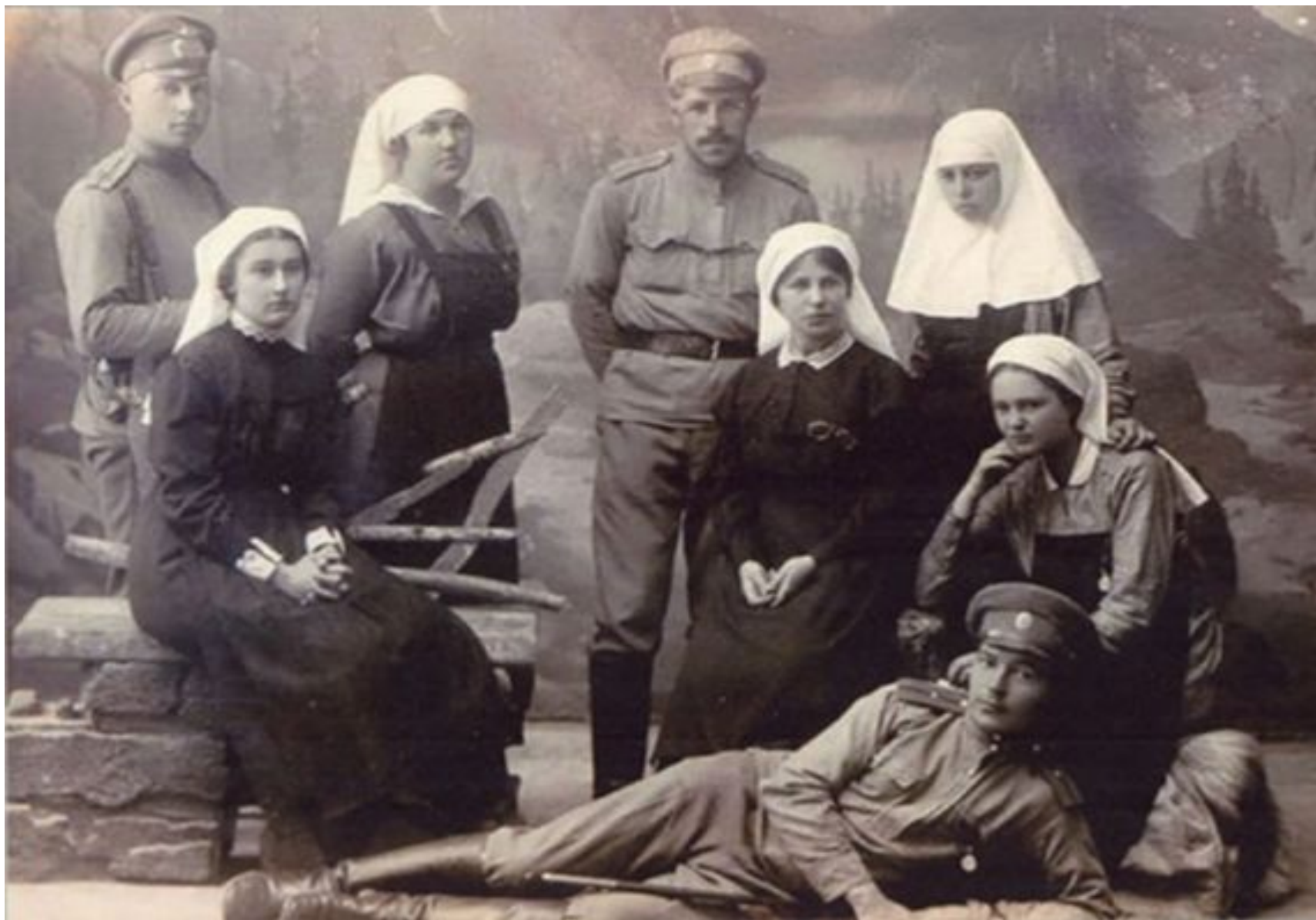
Выпускницы Высших женских врачебных курсов на фронте.