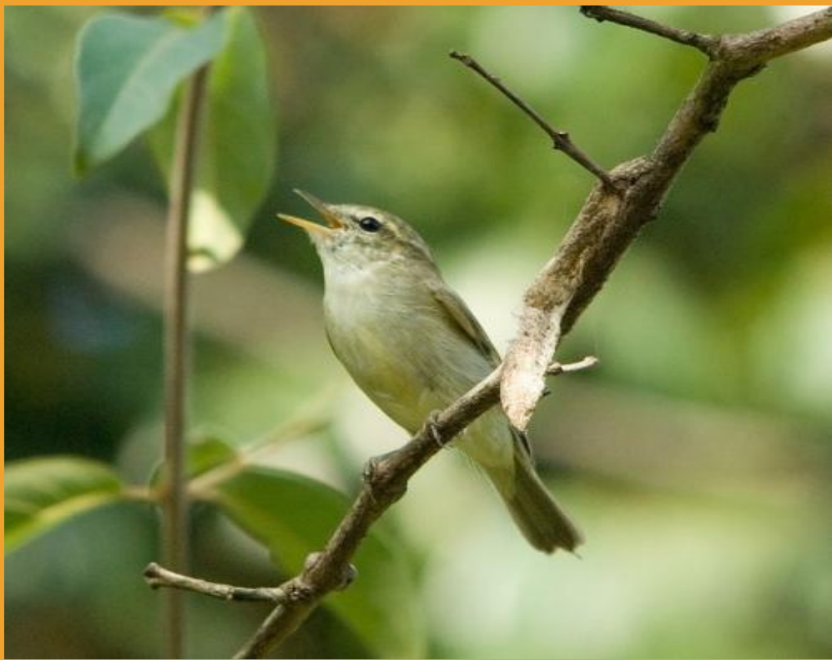
СЛАВКА – ПОРТНИХА