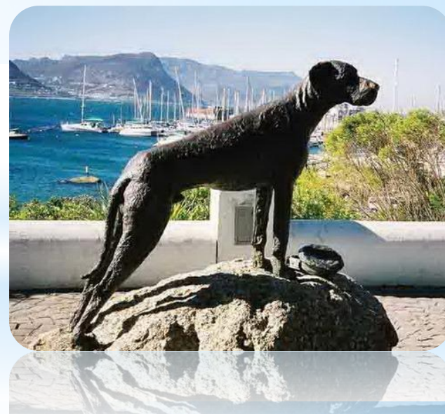
Берлинский зоопарк, Берлин, Германия