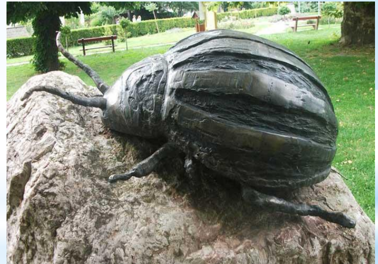
Памятник колорадскому жуку