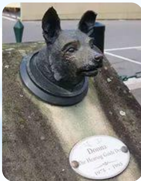
Донне, Сидней, Австралия