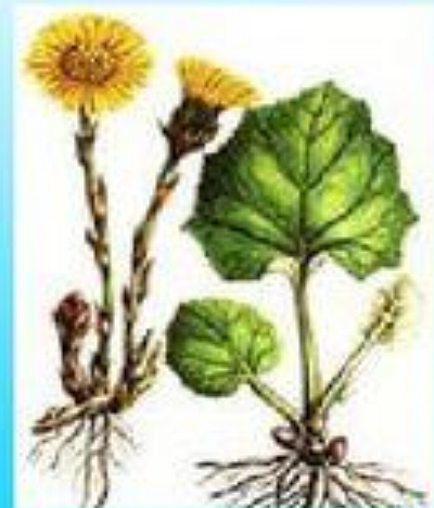
мать и мачеха