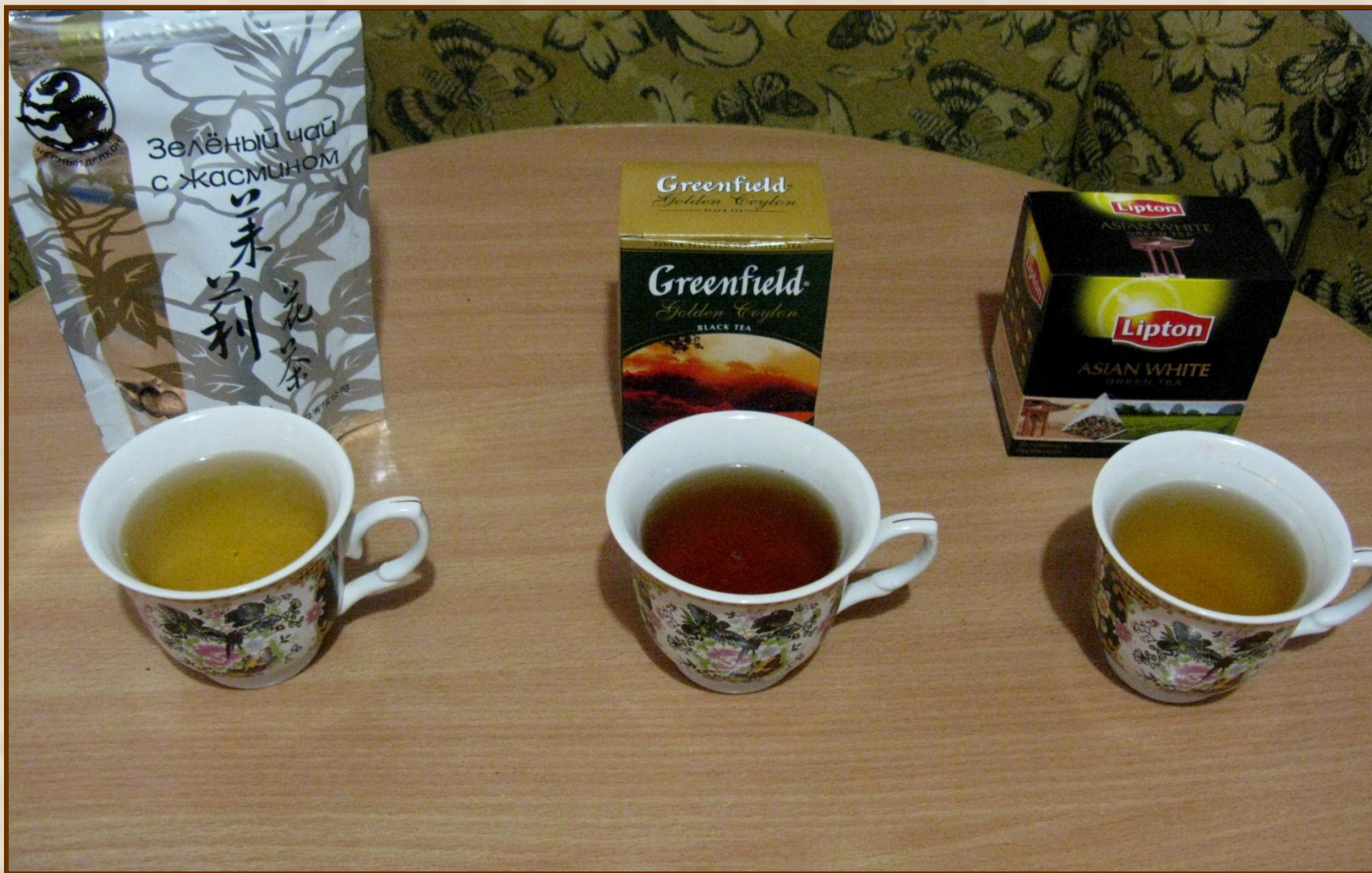
Титестер (англ. «пробующий чай»)