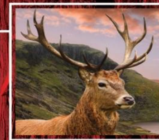
ЖИВОТНЫЕ НАШЕГО ЛЕСА