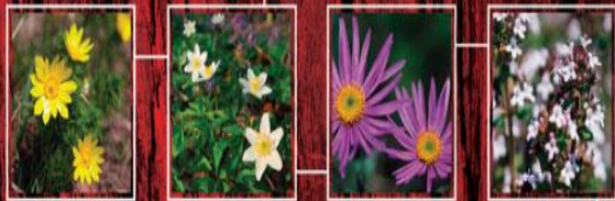
РАСТЕНИЯ НАШИХ ЛЕСОВ И ПОЛЕЙ