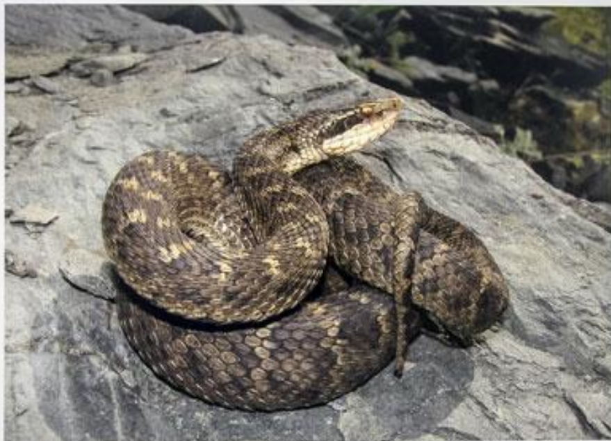
Щитомордник обыкновенный Щитомордник обыкновенный (латинское название) - вид рептилий семейства Ямочные. Распространен в южной части области. Занесен в Красную книгу Московской области.

Единственный вид рептилий занесенный в Красную книгу области.