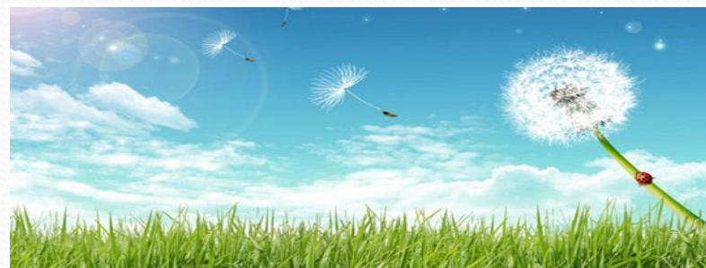
Рис. 2. Прозрачность воздуха.