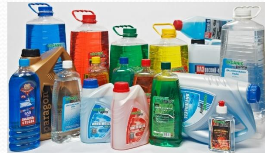
Рис. 8. Растворители.