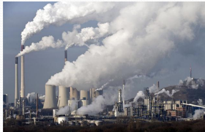
Рис. 5. Выброс теплоэлектростанции.