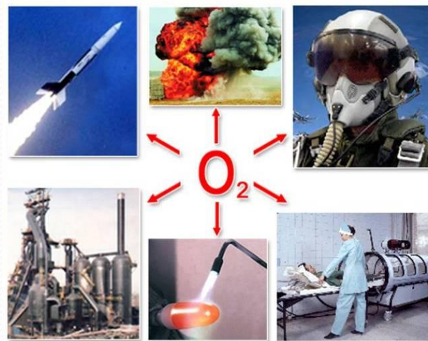
Рис. 4. Применение воздуха человеком.