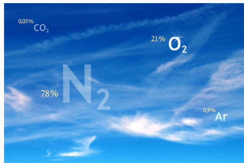
Рис. 1. Состав воздуха.

□ Воздух — естественная смесь газов (главным образом азота и кислорода — 98-99 % в сумме, а также аргона, углекислого газа, воды, водорода), образующая земную атмосферу.