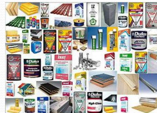
Рис. 9. Строительные материалы.