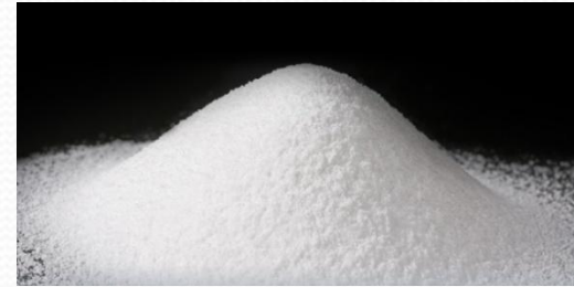
Рис. 7. Свинцовые белила.