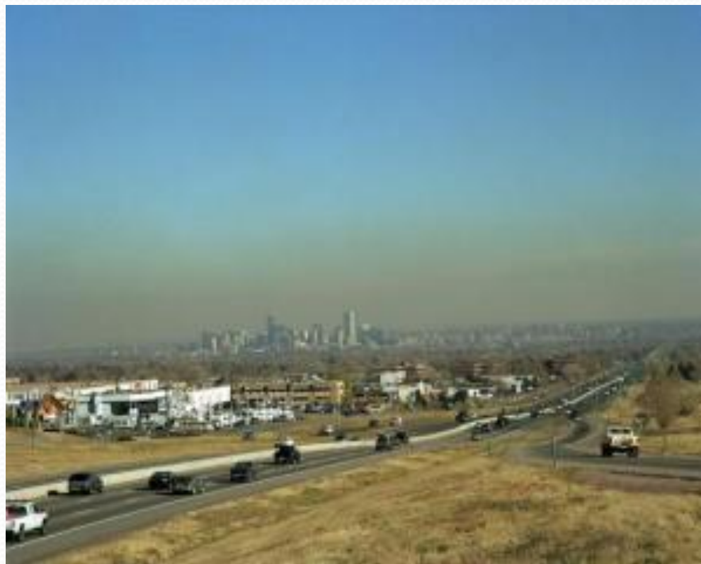
Рис. 10. Смог в черте города.

□ Загрязнение воздуха может нанести вред здоровью людей и животных, повреждению сельскохозяйственных культур или остановить их в росте, и сделать наш мир неприятным и непривлекательным множеством других способов.