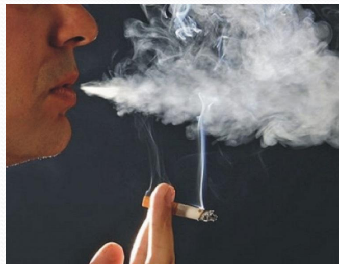
Рис. 6. Табачный дым.