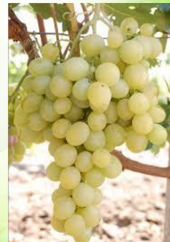
Мускаты – 3 %,