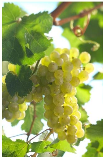
Рислинг – 5%