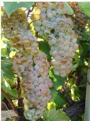
Ркацители – 43 %