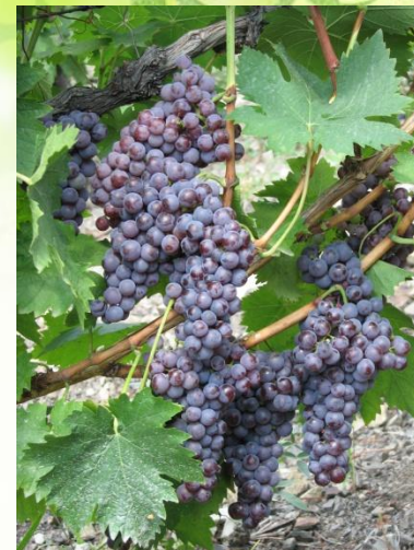
Совиньон каберне и зеленый – 9%.