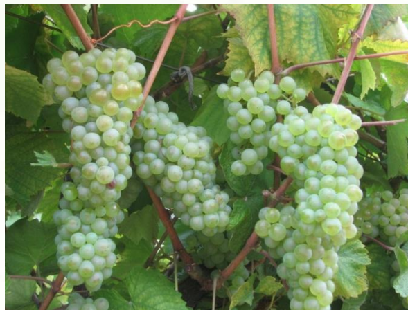
Алиготе – 10 %,