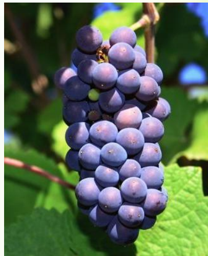
Пино – 3,5 %,