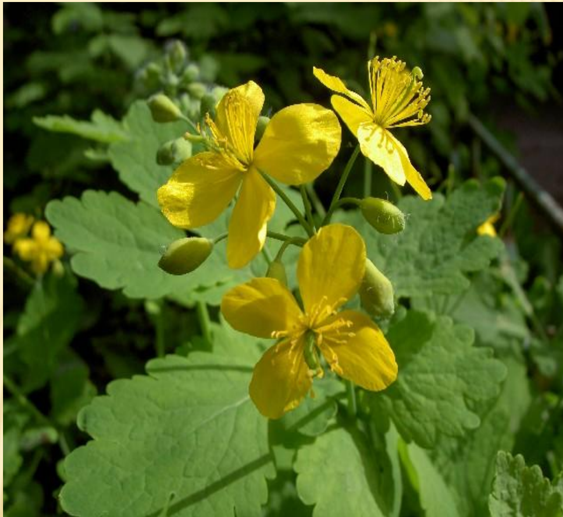
ЧИСТОТЕЛ БОЛЬШОЙ (CHELIDONIUM MAJUS L.)

Чистотел большой ( Chelidonium majus L.) - многолетнее травянистое растение высотой до 1 метра с коротким корневищем.