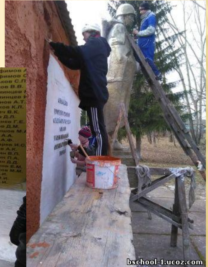
Корниенко К, уч-ся 9 кл