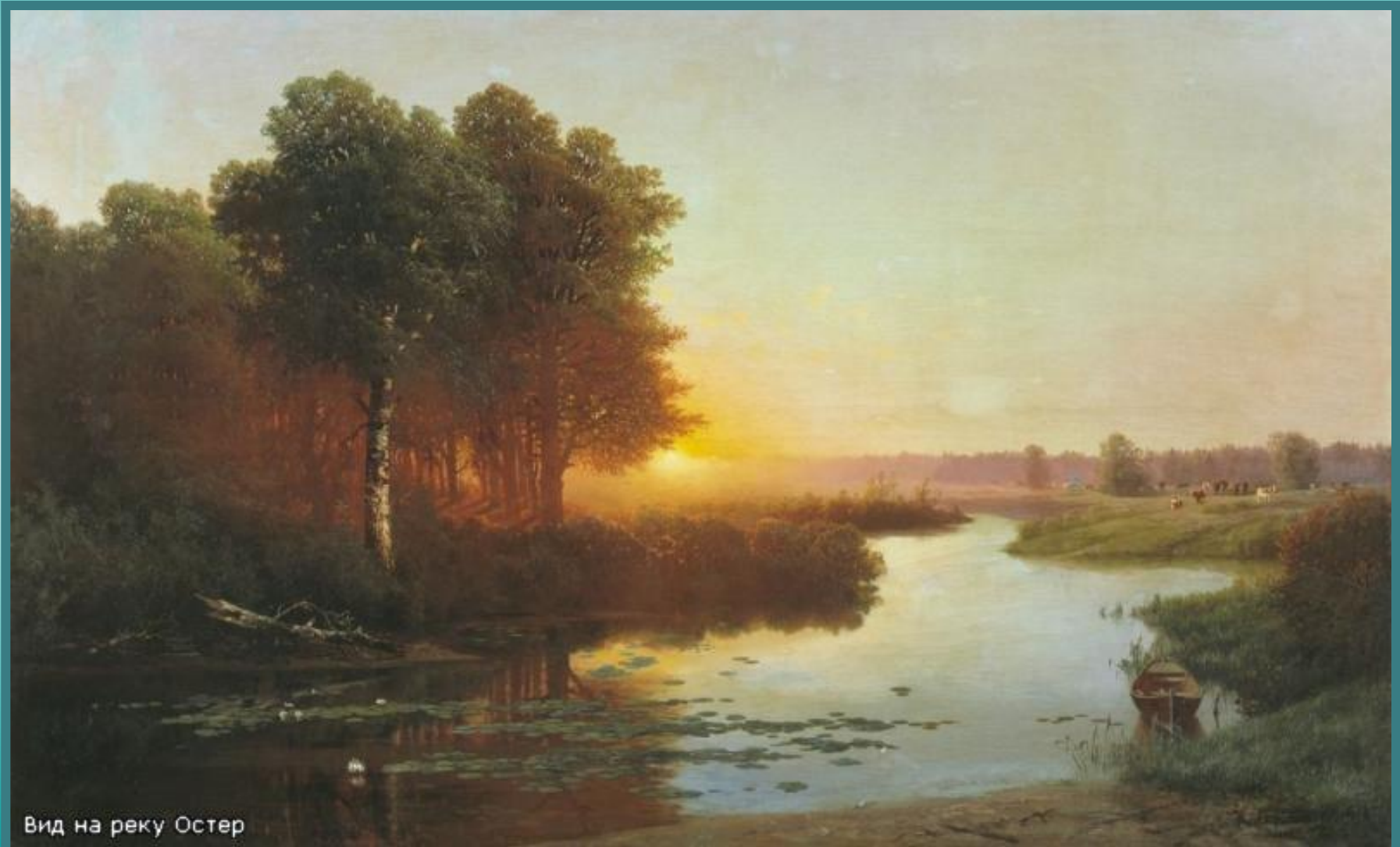
Вид на реку Остер

Пейзаж - это жанр изобразительного искусства, в котором основным предметом изображения является местность, естественная или преобразенная человеком природа: городские и сельские ландшафты, морские виды, виды городов, зданий,