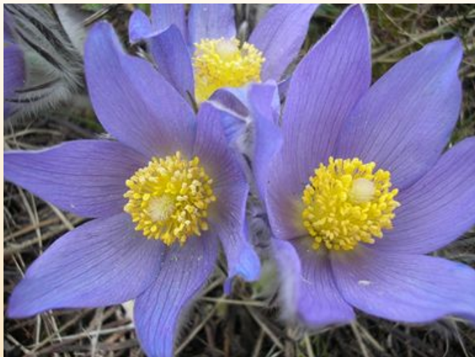
Сон - трава