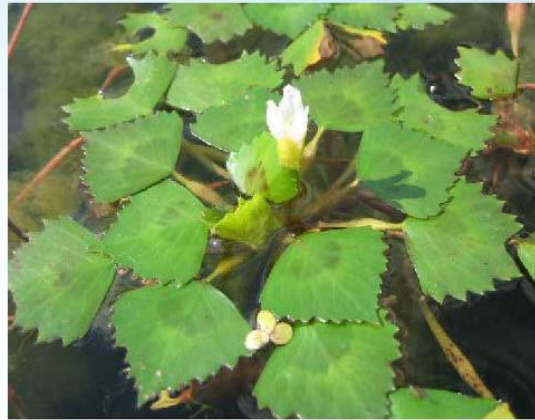
Водяной орех - Trapa natans

Его питательные плоды - костянки местное население употребляло в пищу в годы войны. Сейчас количество растений чилима сокращается, так как его поедают околоводные животные и загрязнения водоёмов