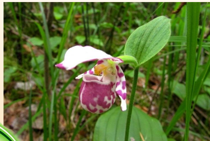
Венерин башмачок капельный