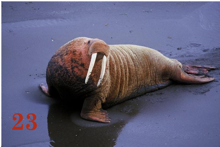
Морж Отряд: «Ластоногие»