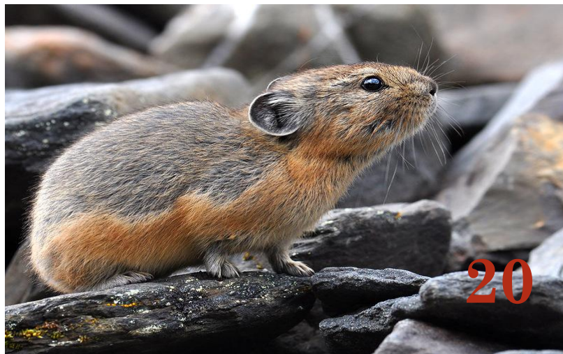
Пищуха северная Отряд: «Зайцеобразные»