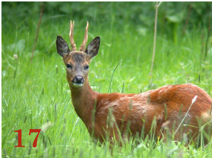
Косуля Отряд: «Парнокопытные»