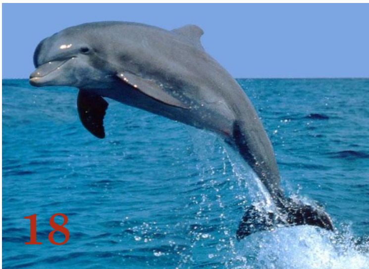
Афалина Отряд: «Китообразные»