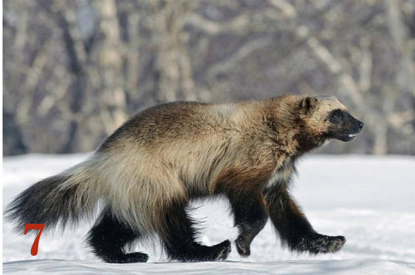
Росомаха Отряд: «Хищные»