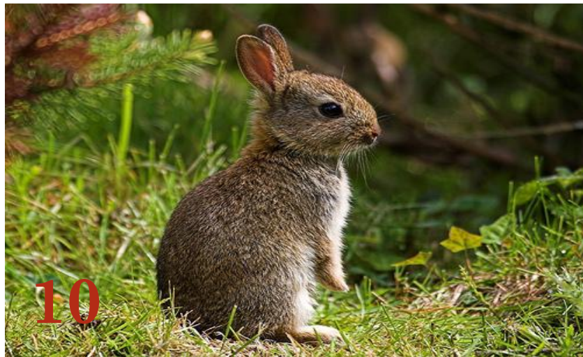
Кролик дикий Отряд: «Зайцеобразные»