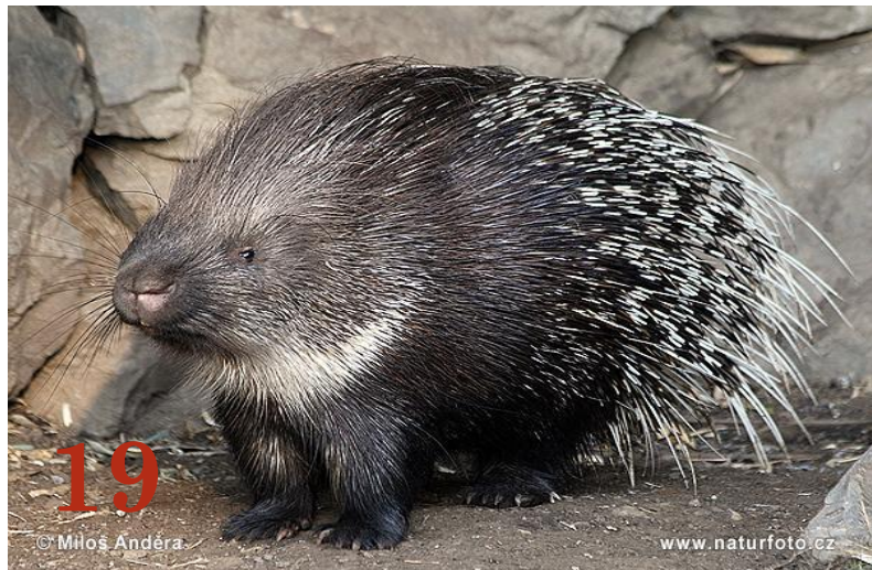
Дикобраз Отряд: «Грызуны»