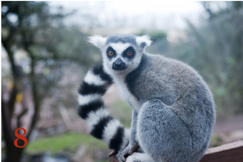
Кошачий лемур или лемур катта Отряд: «Приматы»