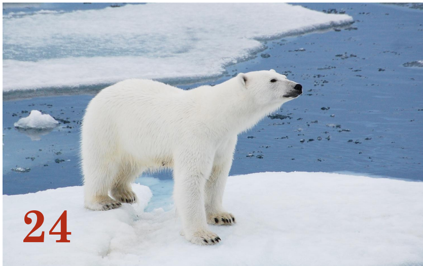
Белый медведь Отряд: «Хищные»