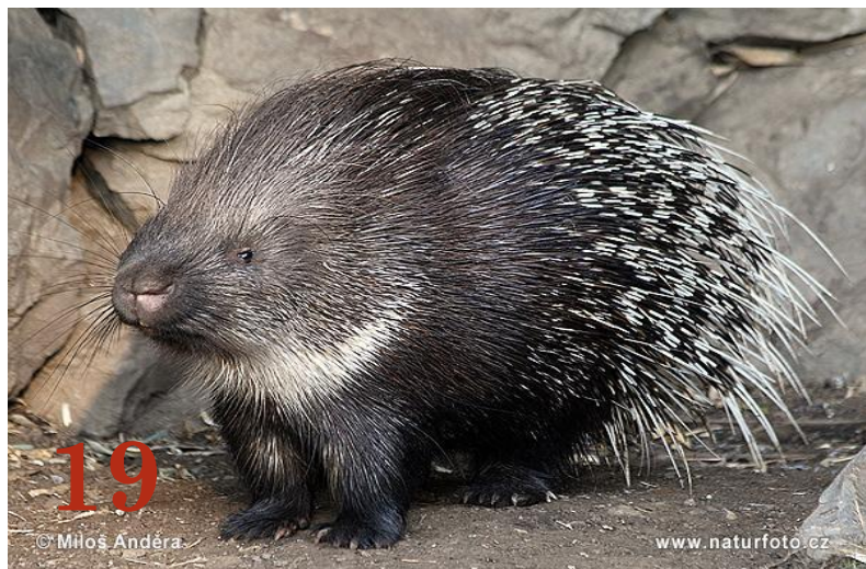
Дикобраз Отряд: «Грызуны»