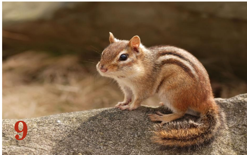
Бурундук Отряд: «Грызуны»

К какому отряду и виду относятся эти животные?