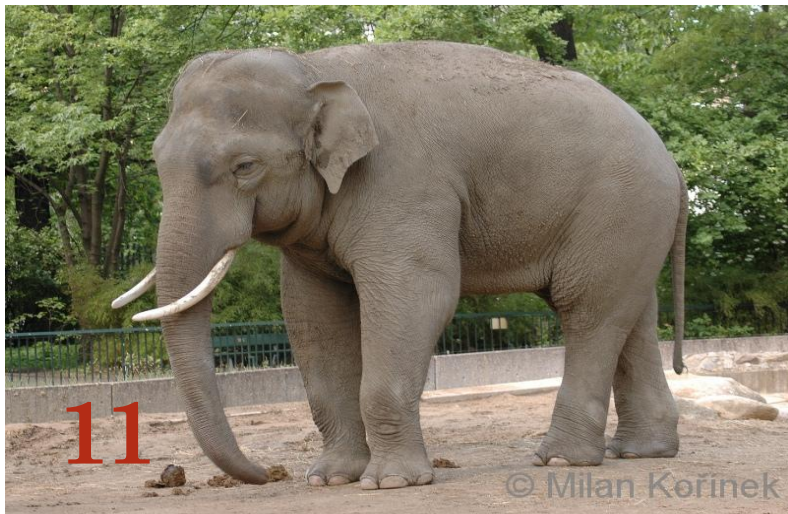
Индийский слон Отряд: «Хоботные»

К какому отряду и виду относятся эти животные?