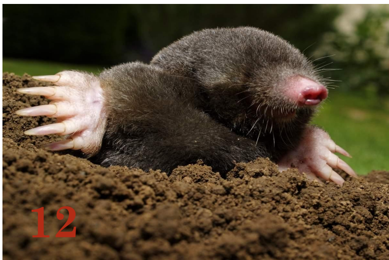
Крот Отряд: «Насекомоядные»