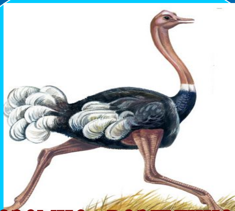
наземно - воздушная