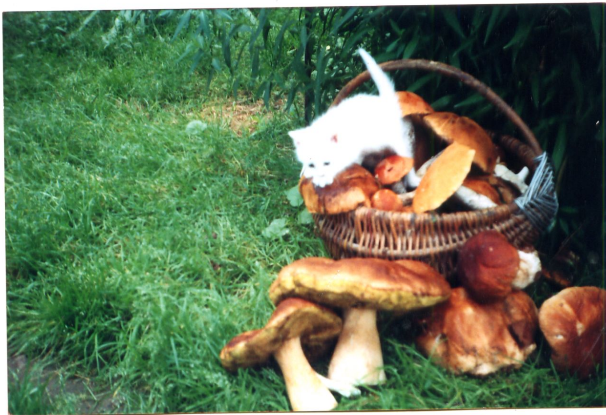
Фото выпускницы 2009 года Филипченко Елены