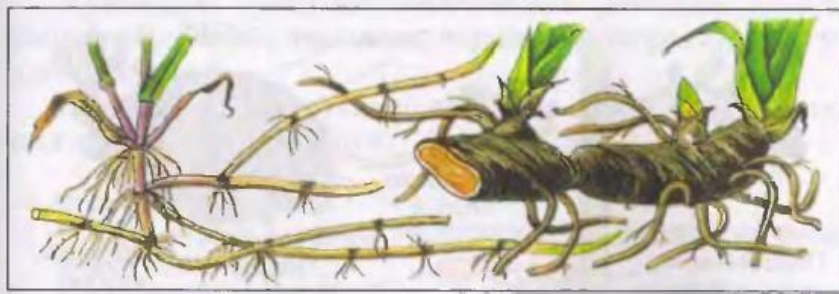
93. Корневища пырея и ириса