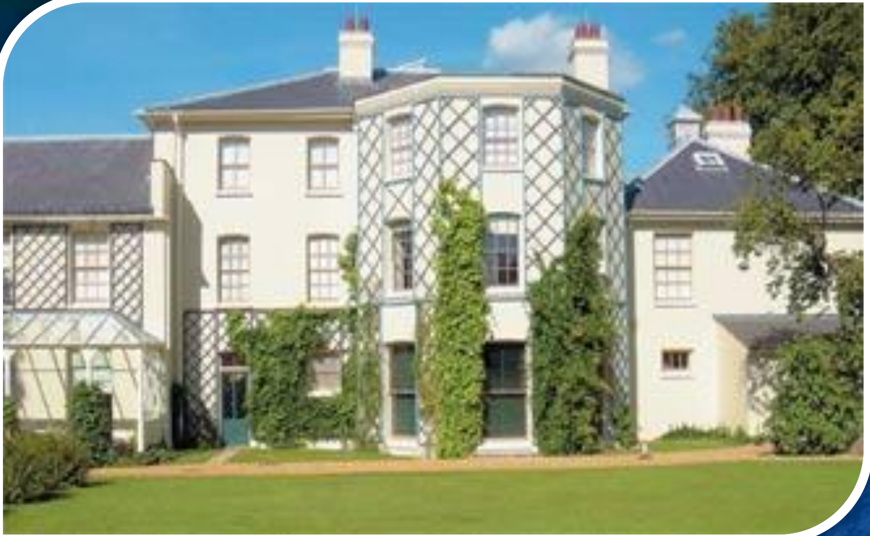
Дом в Доуне, где Ч. Дарвин жил в течение 40 лет (с 1842 по 1882 год).