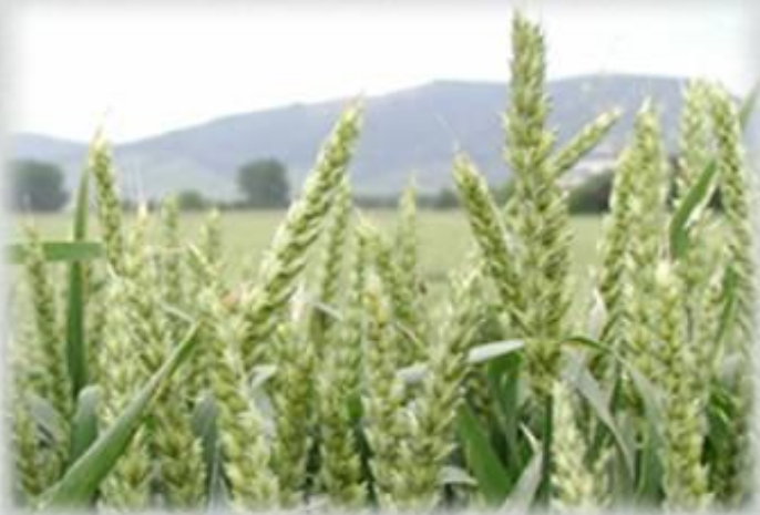
пшеница – самоопыляющееся растение

При создании сортов пшеницы применяют индивидуальный отбор