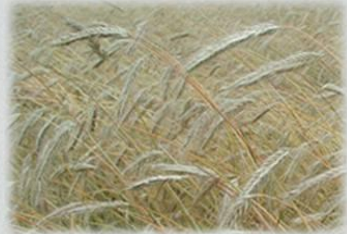
рожь – перекрестно опыляющееся растение

При создании сортов пшеницы применяют индивидуальный отбор