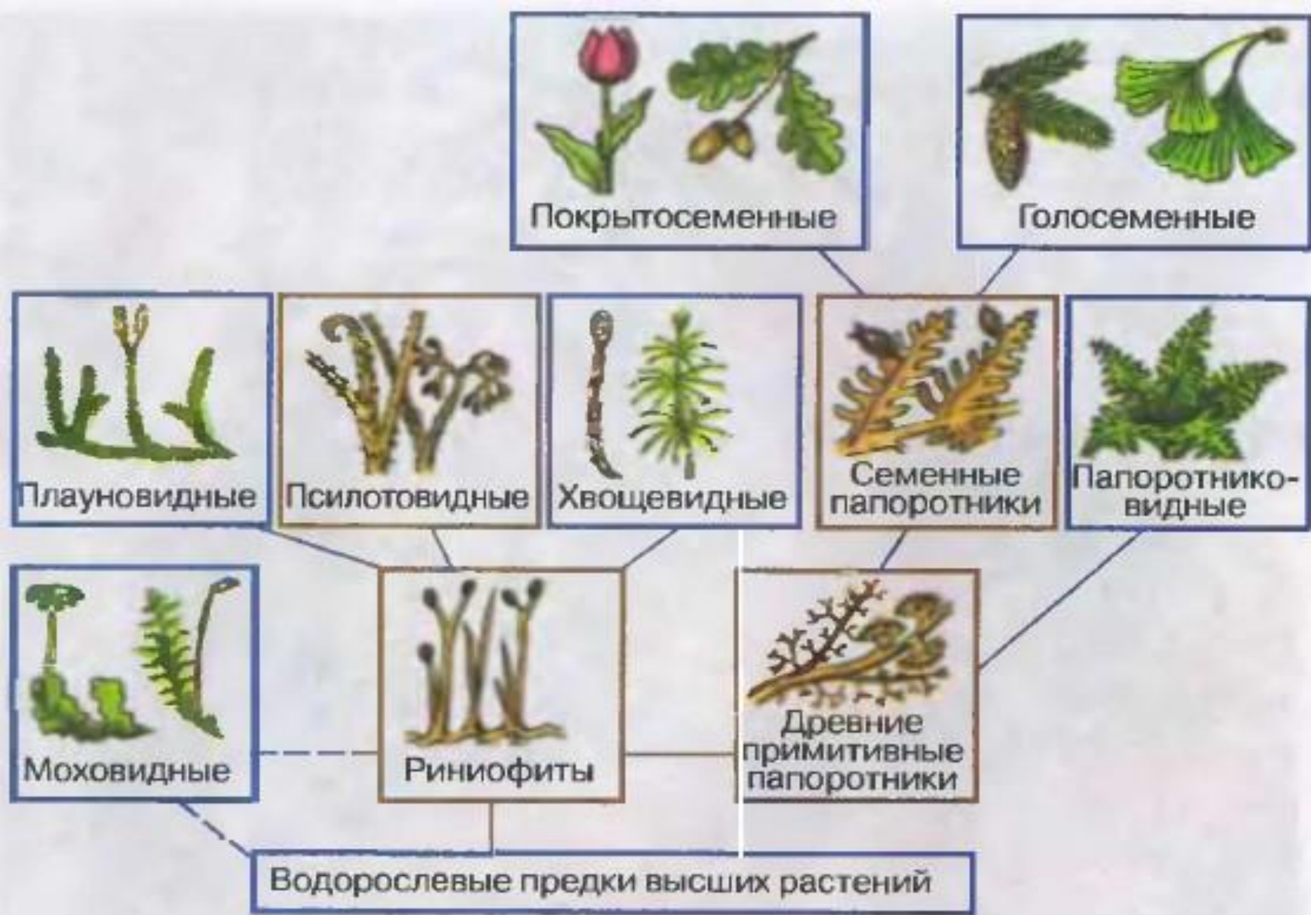
207. Происхождение высших растений