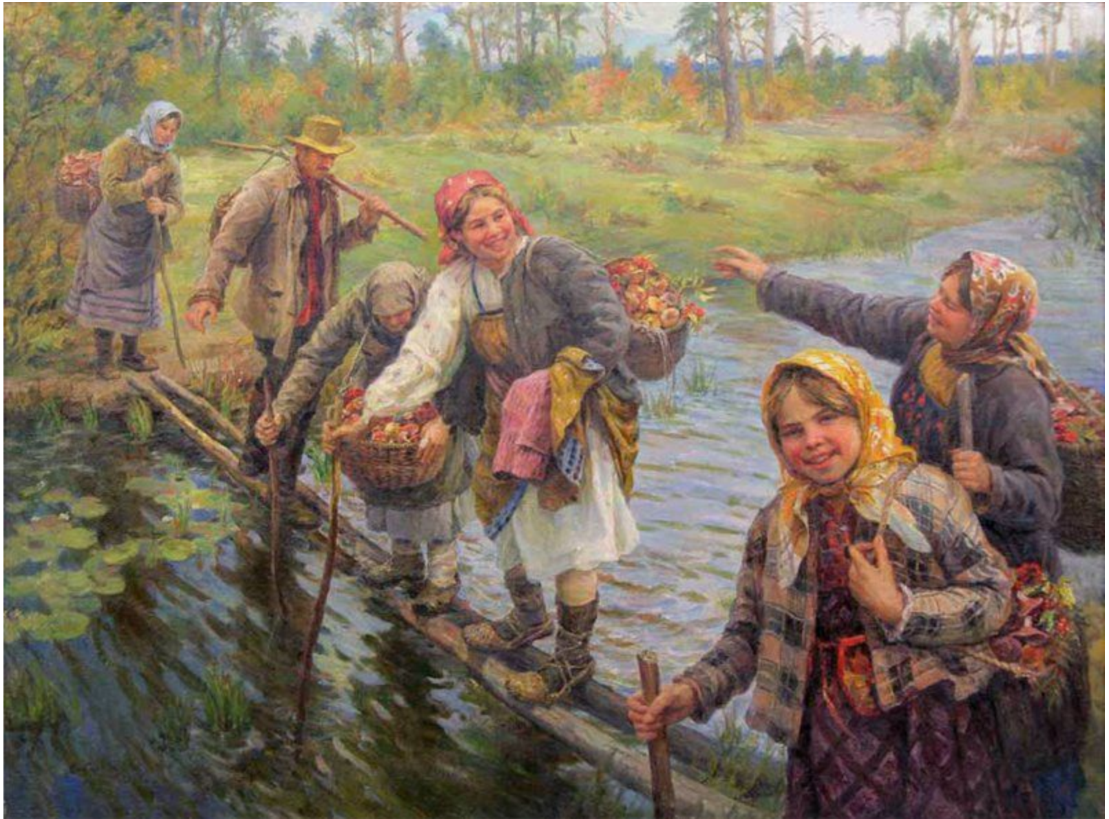
Федот Сычков Из лесу