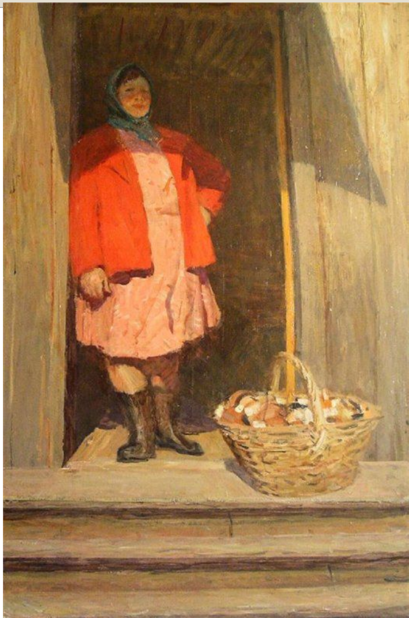
Виктор Цыплаков Грибная пора 1985 г.