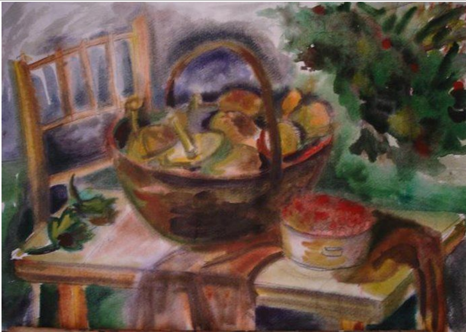
Кухарь Сергей. Конец дачного сезона 2008 г.