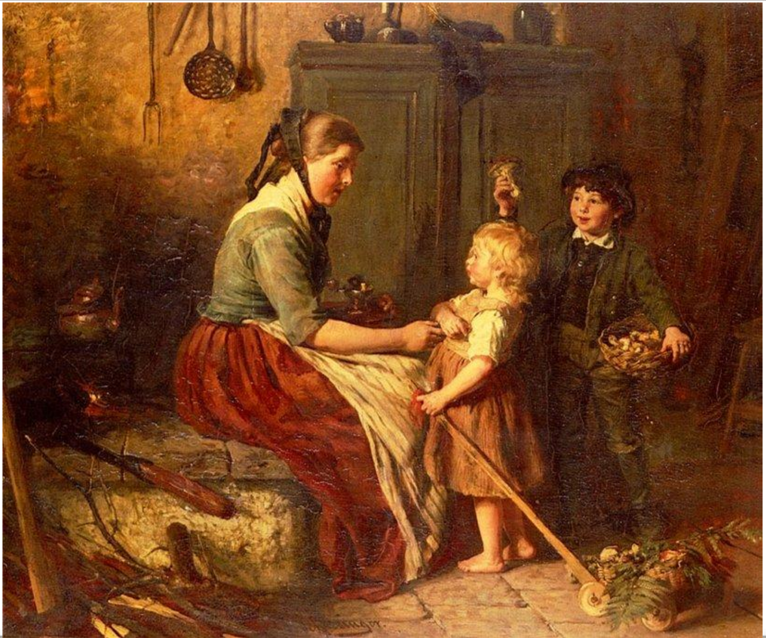
Felix Schlesinger "The Mushroom Gatherers"