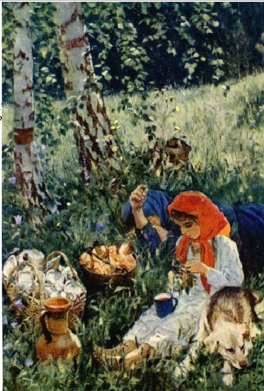
Аркадий Пластов Летом. 1953-54 г.г. Русский музей