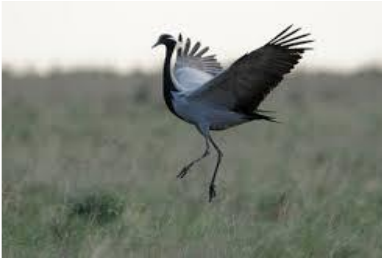
Журавль - красавка