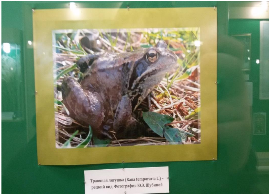
Травяная лягушка ( Rana temporaria L.) - редкий вид.