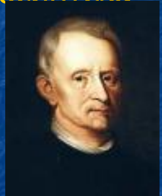
Ян ван Гельмонт

Ян ван Гельмонт поставил первый эксперимент по изучению питания растений.