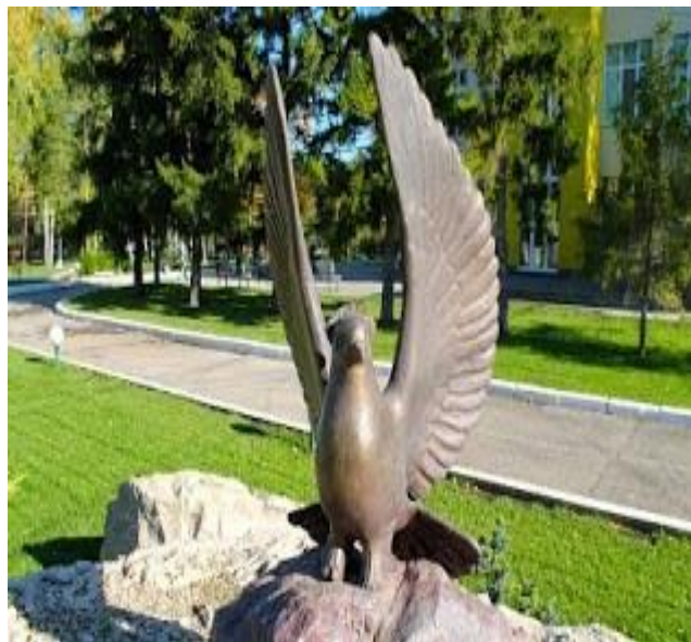
Самара. Памятник почтовому голубю

Голуби — это не просто городские жители, которых мы встречаем каждый день. В недалёком прошлом люди использовали их как средство связи. Дело в том, что эта птица отличается поразительной способностью возвращаться к родному гнезду. Эту способность издавна применяли для доставки сообщений голубиной почтой. Известен тот факт, что в годы Великой Отечественной войны в Советской Армии около 15 тысяч сообщений было доставлено почтовыми голубями. Передавали вести с фронтов, мест расположения партизанских отрядов и военных частей. Люди помнят и чтят своих помощников. В благодарность и напоминание о важности службы этих птиц и поставлен памятник.