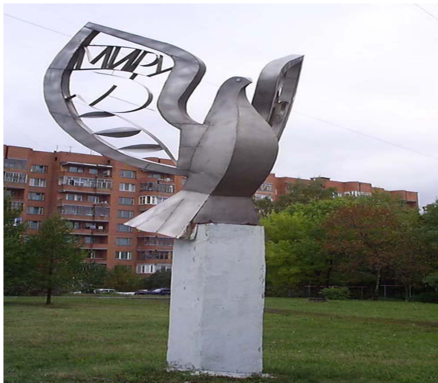
Владивосток. Памятник голубю как символу мира

Памятник этому голубю установлен в 2004 году. Его автор — немецкий художник Вольфрам Курзенбергер. Голубь, выполненный из алюминия, как бы висит между землёй и небом. «Когда он раскачивается на ветру, то звенит как колокол, напоминая о том, как хрупок мир», — заявляет его создатель.