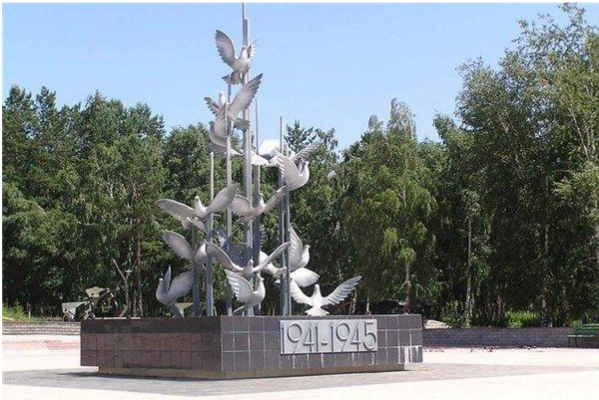
Ангарск. Голуби мира

Памятник в Ангарске — это скульптурное изображение стаи из 17 голубей, кружащихся над землёй. Эти мирные птицы, застывшие в полёте, символизируют Победу, мирную жизнь и начавшееся строительство города. Открытие памятника было приурочено ко Дню Победы в 2005 году. Вся композиция имеет довольно внушительные размеры. Вес каждого голубя 250 килограмм, общий вес памятника 8 тонн, а его высота 8 метров.