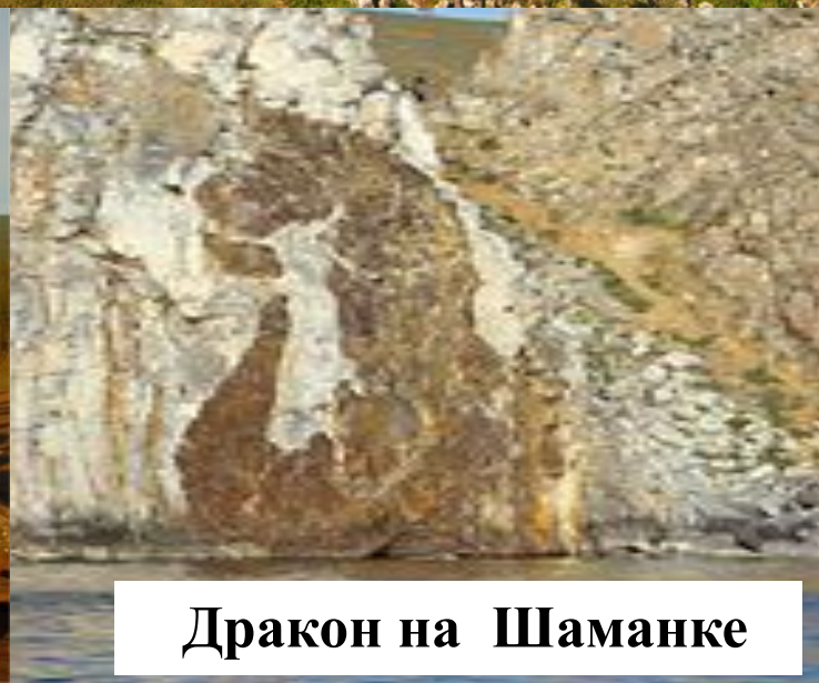
Дракон на Шаманке