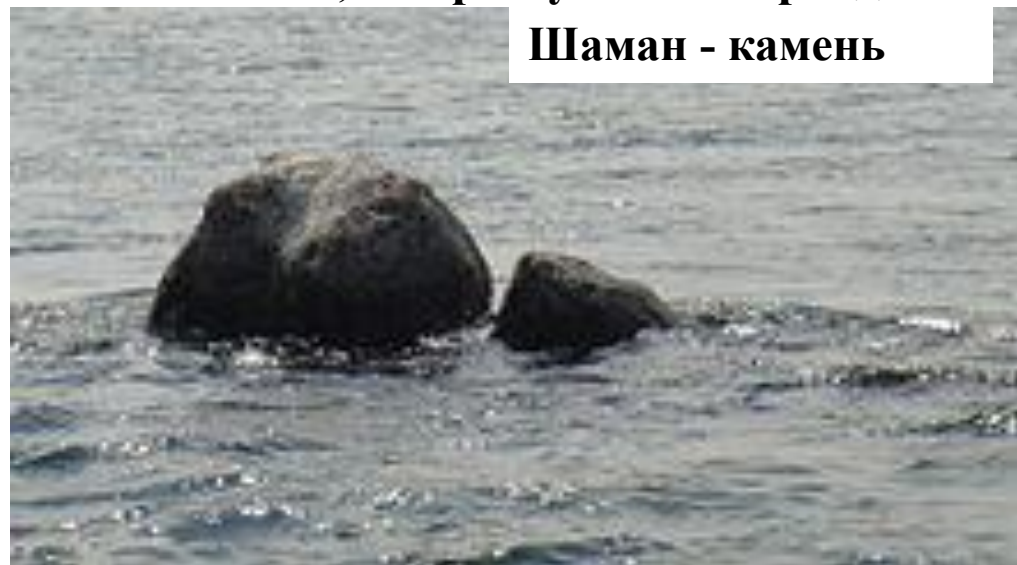
Шаман - камень

С древности Шаман-камень наделяли необычной силой. Здесь молились и проводили важные обряды, также привозили преступника и оставляли его на камне. И если ночью воды Байкала его не смывали, то преступника оправдывали.