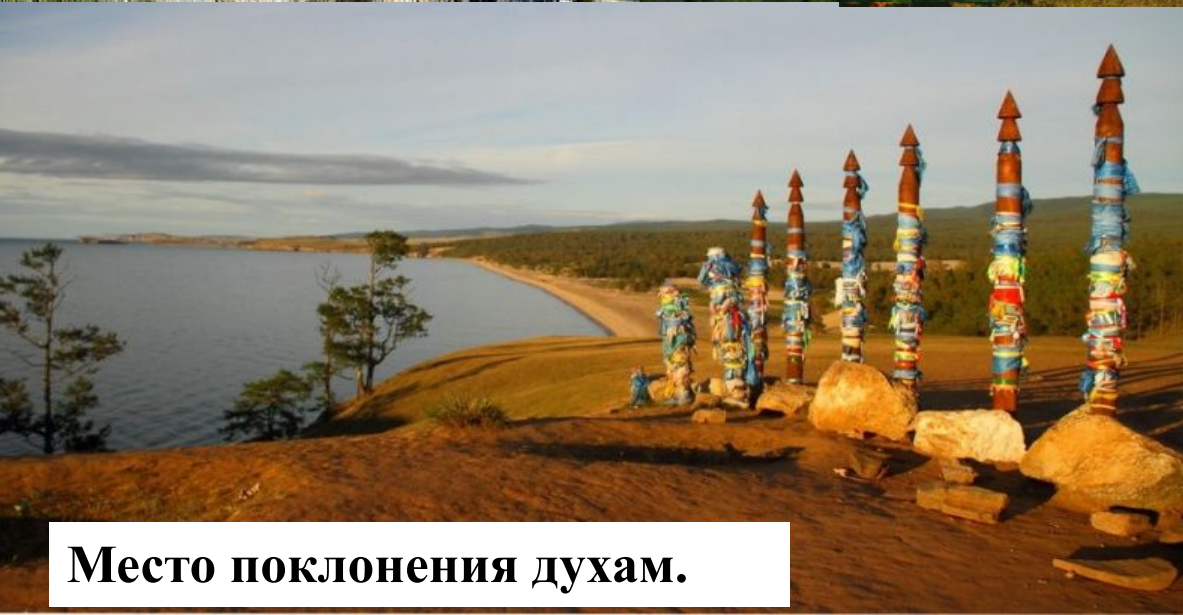
Место поклонения духам.