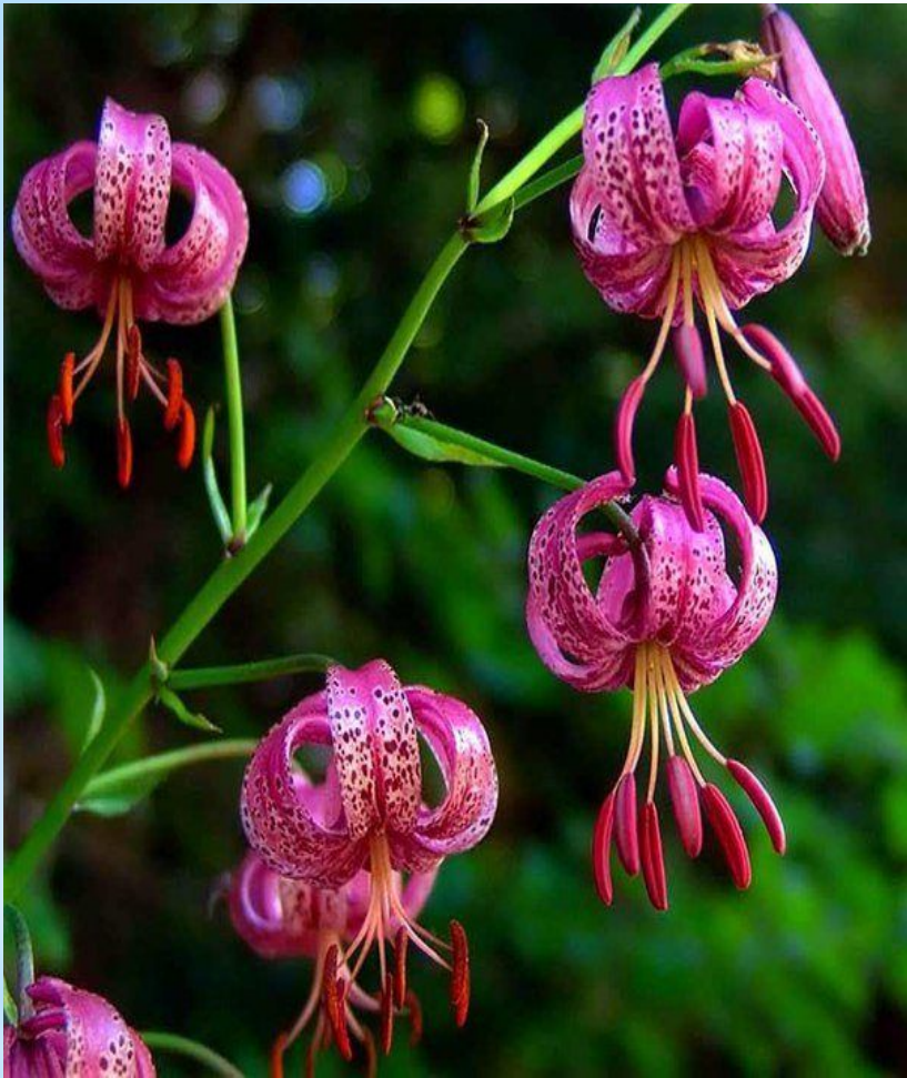
Лилия волосистая (саранка)