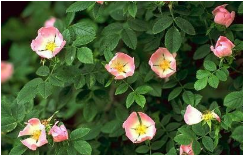
Роза большелистная с 14 хромосомами