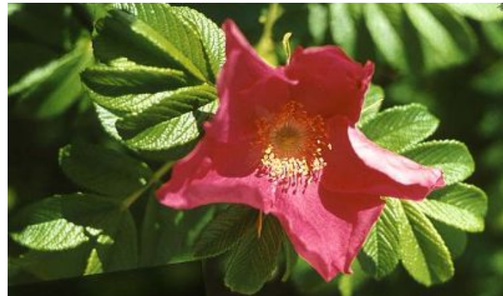
Роза большелистная с 28 хромосомами