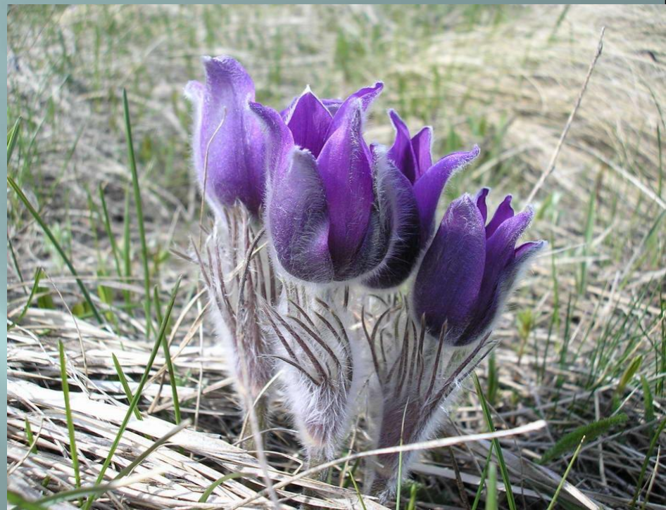
Прострел или сон-трава