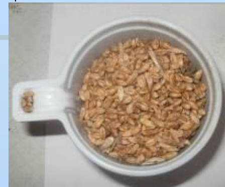
Пшеница – корм, если больше нечего покушать

Так же заметили, что воробьи уступают в борьбе за пищу (предположительно, из-за преимущества синиц над воробьями). Дятел кормится всегда в одиночестве, соперники отлетают в сторону и ждут, пока тот не улетит.