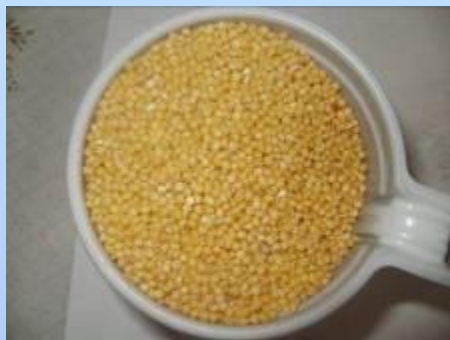
Пшено – один из самых любимых видов пищи

Очень интересным фактом оказалось, что птицы не клюют одну и ту же пищу каждый день. Т.е.они соблюдают разнообразие в пищевом рационе.