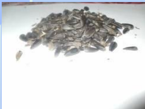
Подсолнечник – довольно популярный корм