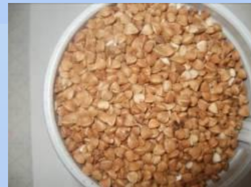
Гречиха – мы и не думали, что так понравится!