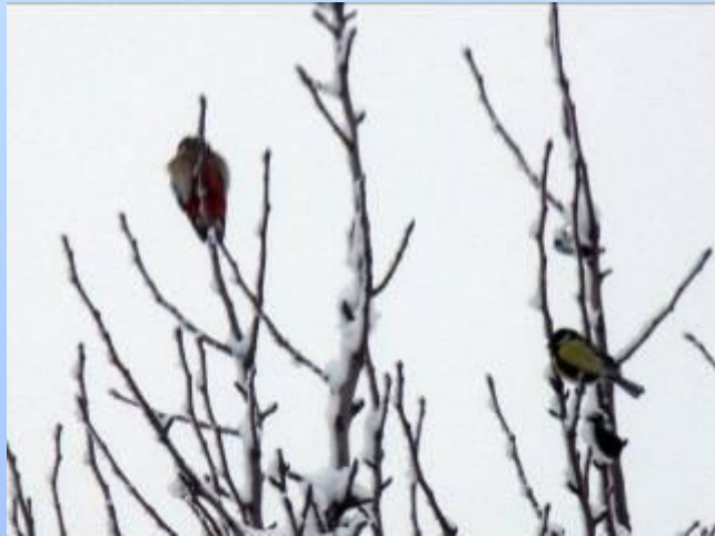
По соседству с синицей