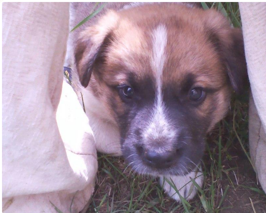
Алтай когда его только привезли.

Еще у нас есть собака – Алтай . Ему 6 ноября исполнилось 6 месяцев. Он очень активный и игривый. Он живет на улице в своей конуре. Папа каждый день ходит с ним гулять. Алтай спокойный щенок. Он не тяфкает на других и не лезет к ним. Наш щенок никогда не кусается, но только если когда мы играем с ним, и то легонько. Но мы не разрешаем ему этого делать, даже во время игры. Алтай очень ласковый и добрый. Мы его очень любим.