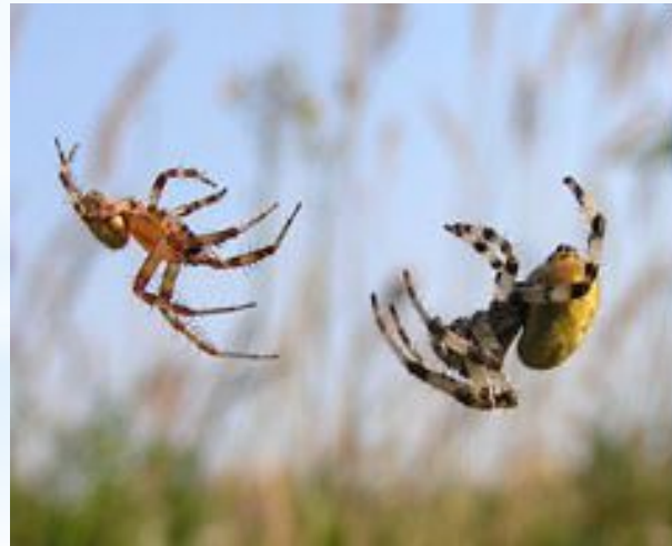
Самец и самка крестовика квадратного