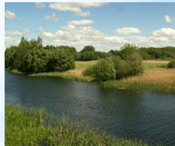
Участок Пойма Псла