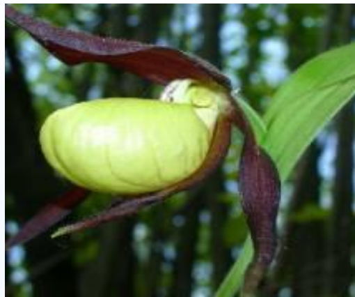
Венерин башмачок настоящий