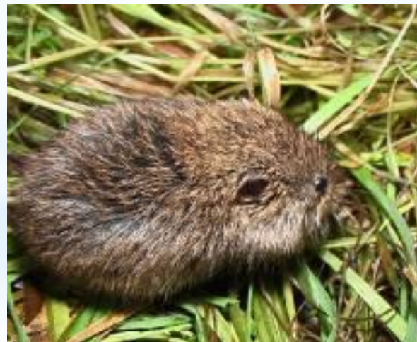
23 Полевка обыкновенная