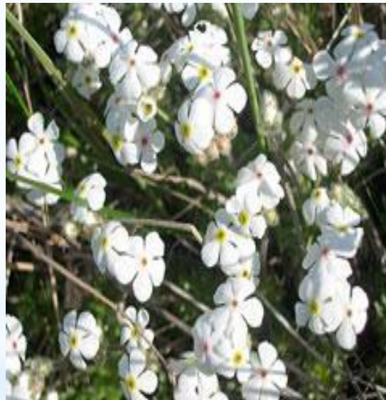
Проломник Козо- Полянского