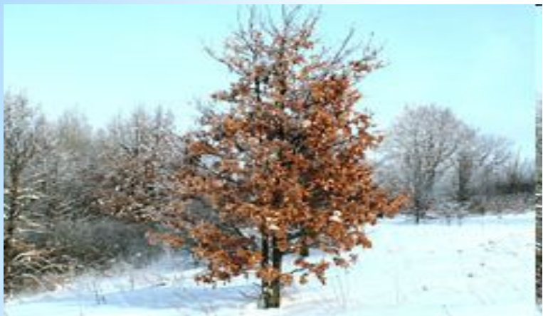
Дуб, не сбрасывающий листья на зиму