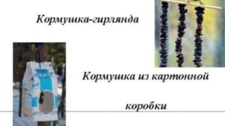
Кормушка-гирлянда Кормушка из картонной коробки