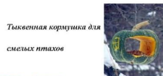
Тыквенная кормушка для смелых птахов