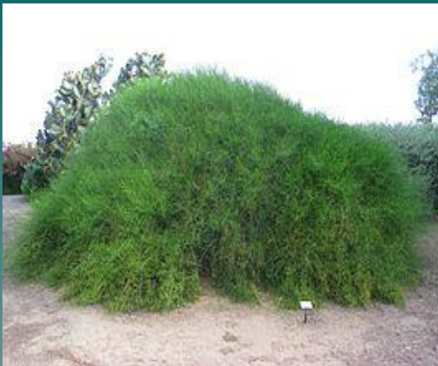
Хвóйник, или эфédра. Эфедра американская