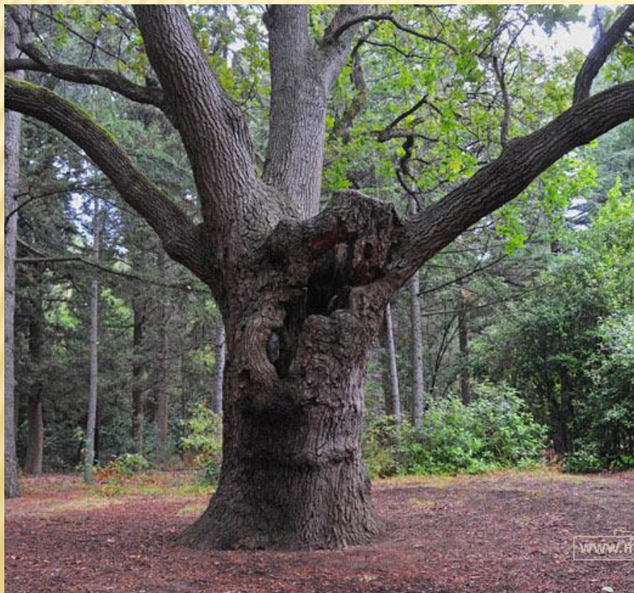
Дуб в Гурзуфе