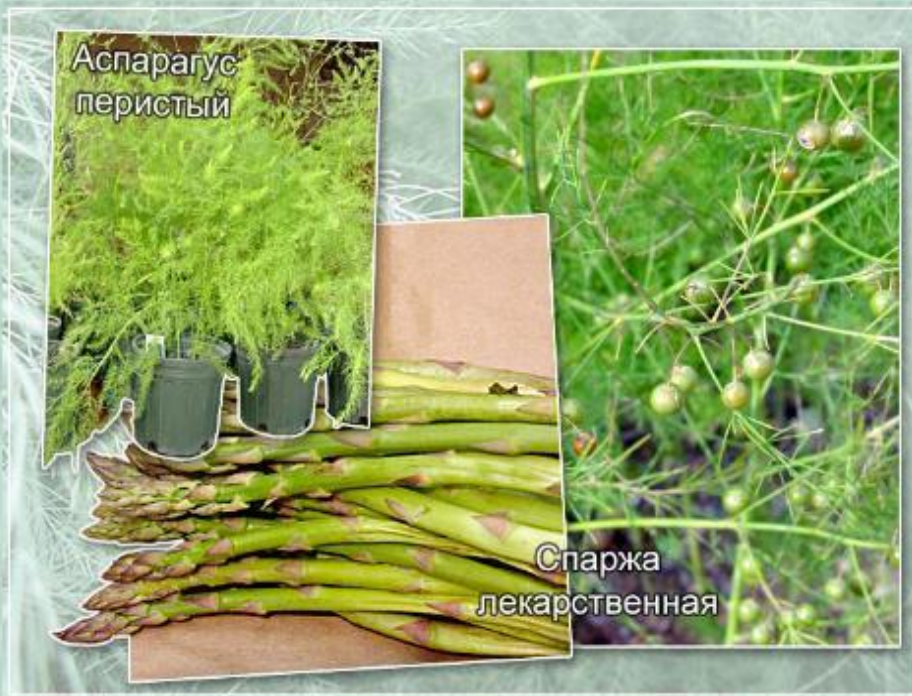
Побеги и плоды различных видов аспарагуса.

Различные виды спаржи (или аспарагуса) также относятся к лилейным. Среди них есть как корневищные растения, так и растения, образующие клубни.