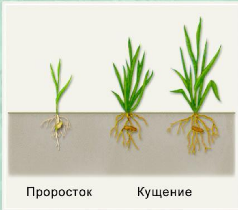
Стадии развития злаков.

В цикле развития многих злаков можно выделить определенные фазы: